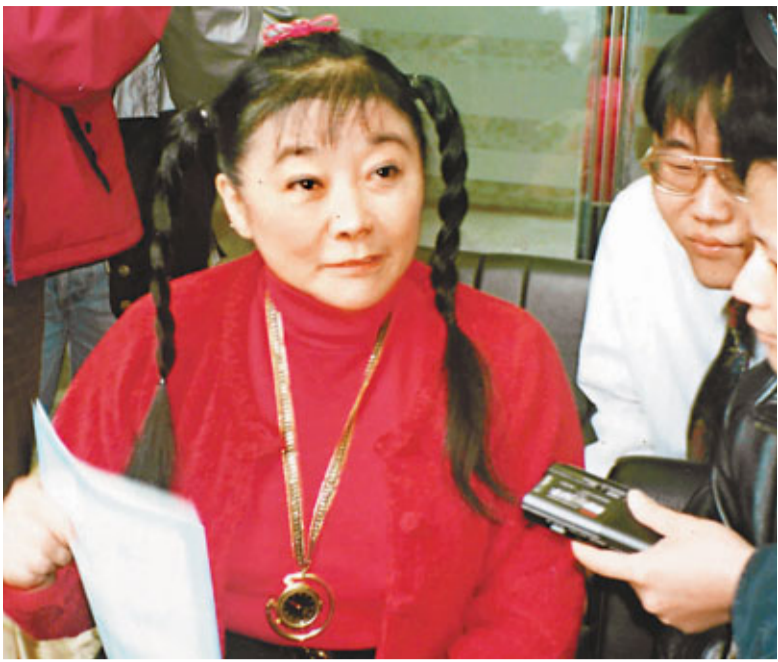
■已故華懋集團主席龔如心生前熱心慈善公益事業。圖為她向記者講述自己捐助內地教育事業情況。