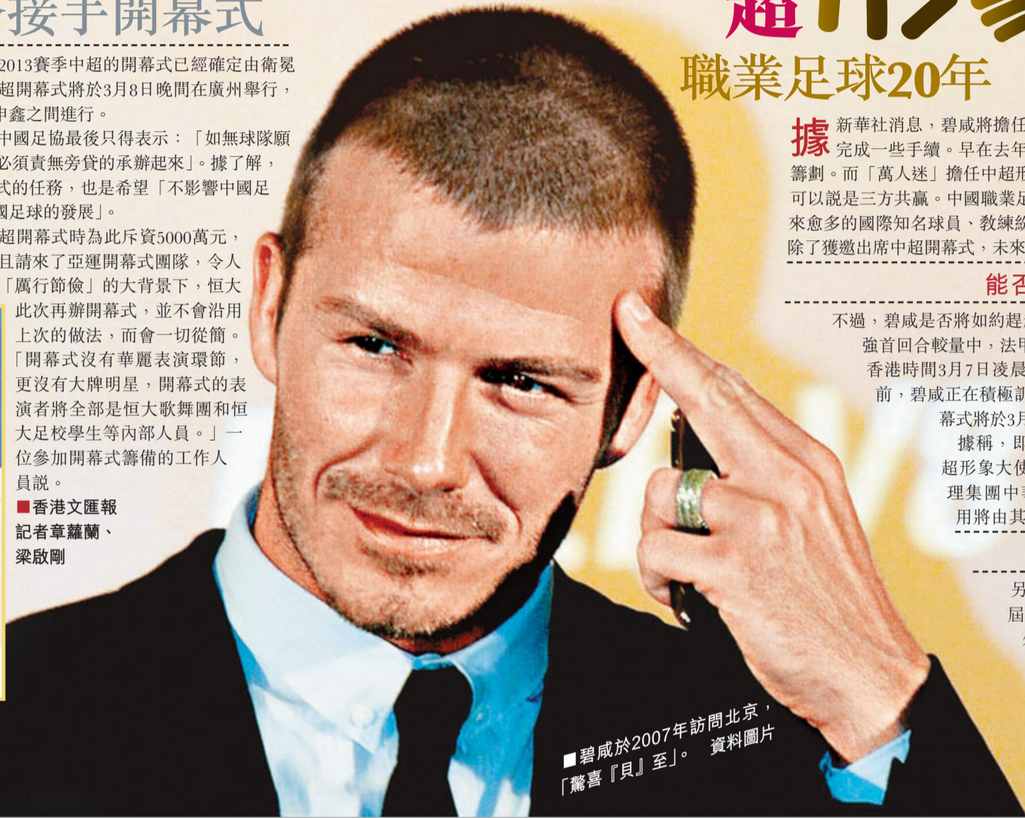
■碧咸於2007年訪問北京，「驚喜」貝至。

據新華社消息，碧咸將擔任新賽季中超國際形象大使基本已經確定，但還需要最後完成一些手續。早在去年下半年，中超公司就開始了職業聯賽20周年慶典活動的籌劃。而「萬人迷」擔任中超形象大使，這一合作對中超聯賽、央視IMG公司和他本人可以說是三方共贏。中國職業足球聯賽經過20年的歷練，已經逐步展現出積極態勢，愈來愈多的國際知名球員、教練紛紛「登陸」中超，對中超起到了很好的宣傳作用。碧咸除了獲邀出席中超開幕式，未來還將參加中超一系列重要的活動。