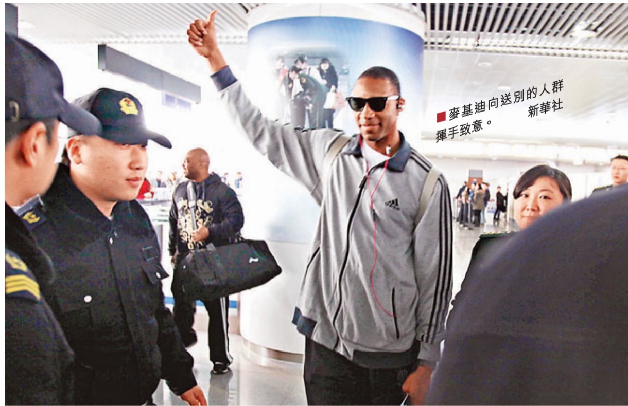
■麥基迪向送別的人群揮手致意。

再見，麥基迪！前NBA巨星麥基迪21日上午10時40分乘坐大韓航空KE846經青島流亭國際機場離開中國，結束了他的首個CBA(中國男籃職業聯賽)之旅。青島總經理生錫順到機場為麥基迪送行，在擁抱時，生錫順動情落淚，而麥基迪也濕了眼眶。