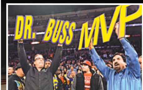
湖人球迷舉牌紀念畢斯。