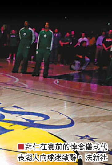
拜仁在賽前的悼念儀式代表湖人向球迷致辭。