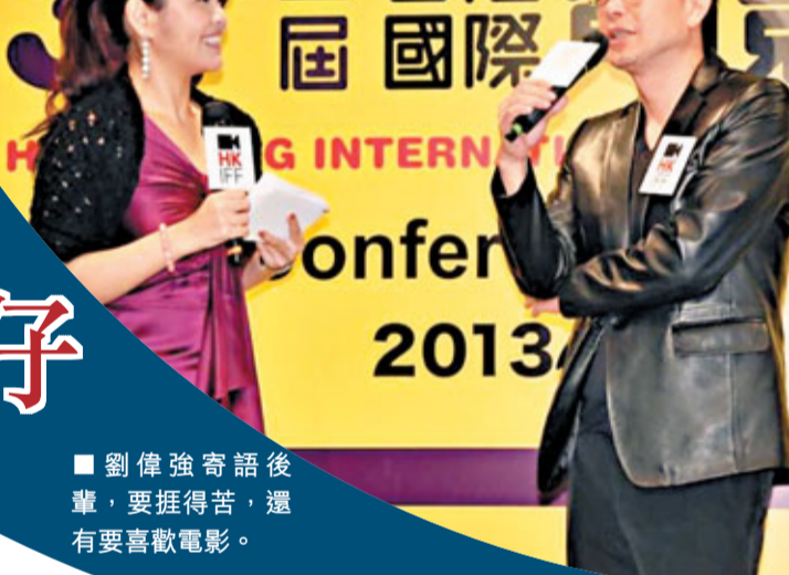
劉偉強寄語後輩，要捱得苦，還要有喜歡電影。