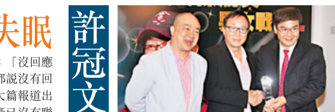
許冠文(圖中)與高志森再次合作棟篤笑，為救助內地白內障病患出一分力。