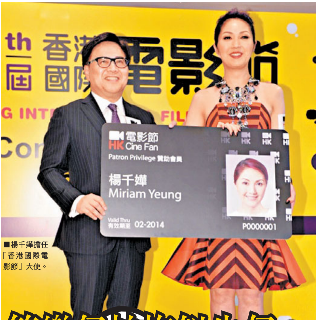
楊千嬅擔任「香港國際電影節」大使。