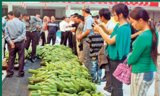
■香蕉是雲南亞熱帶地區的優勢產業。