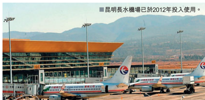
■昆明長水機場已於2012年投入使用。

和連接歐亞的第四大國家門戶樞紐機場。在中國西部地區,這是唯一的國家門戶樞紐機場。