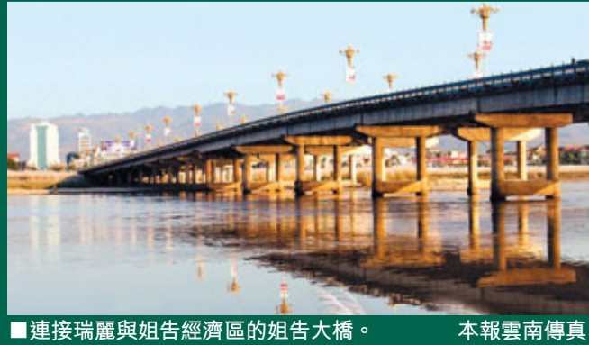
■連接瑞麗與姐告經濟區的姐告大橋。 本報雲南傳真