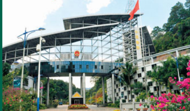
■中老邊境磨憨口岸門,以漢字「和」造型。 本報記者丁樹勇 攝