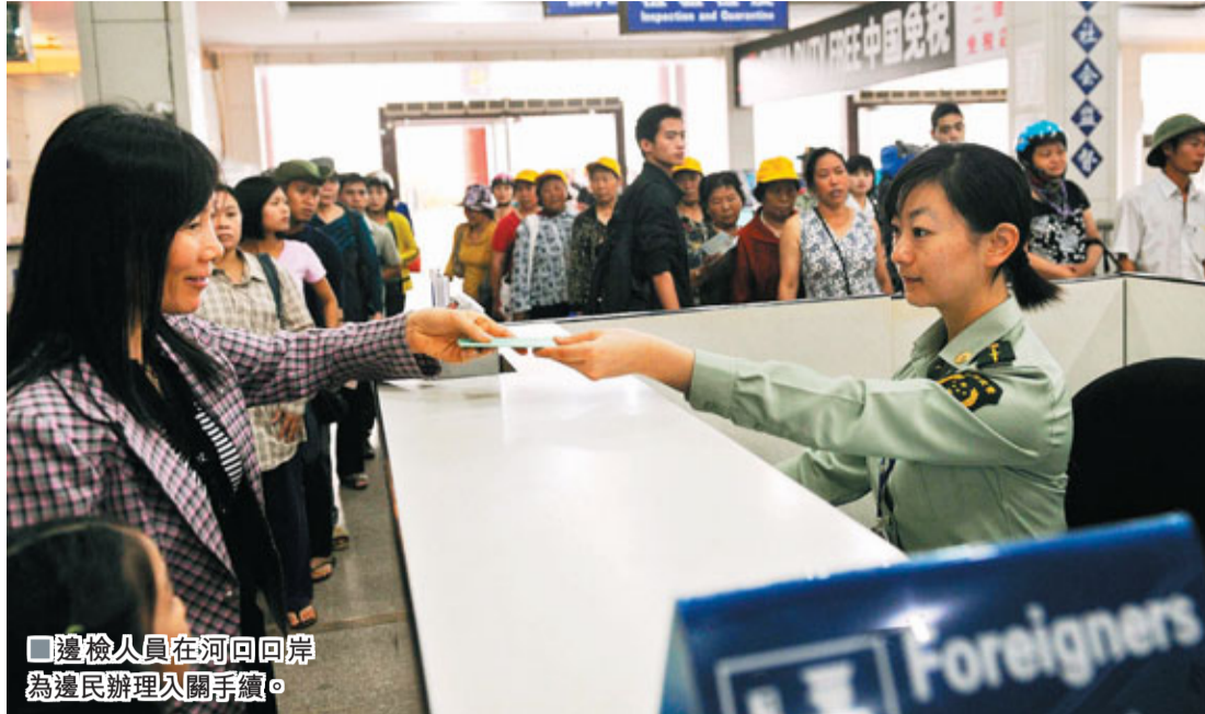
邊檢人員在河口口岸為邊民辦理回籍手續。

「再造一個昆明。」段鋼談及滇中產業新區的設想,難掩興奮。新的產業新區將通過研究實施創新投資建設模式、創新投資審批管理機制等10個方面的重大創新政策,吸引央企、民企、外企入滇,以產業發展作為新區建設的重中之重,着力打造一大批戰略性新興產業和