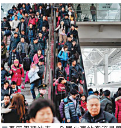
■春節假期結束，全國火車站客流量攀升，鐵路返程客流高峰再現。

香港文匯報訊（記者 郭若溪、通訊員 曾勇 深圳報導）元宵將近，廣東地區仍處於返程客流高峰，記者從廣鐵集團獲悉，截至昨日，廣鐵集團累計發送旅客2,336萬，同比增長8.3%，日均發送旅客86.7萬。節後廣東地區累計299.4萬旅客抵粵，由於學生客流還未出行，當前客流仍主要以返程務工人員、探親旅遊為主。