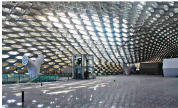
■T3航站樓北指廊。 資料圖片