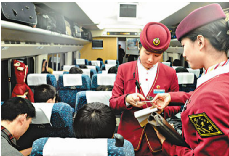
■北京鐵路客運段高鐵二隊D311次四組年輕列車員在車上檢驗車票。

作為快速通網的骨幹，北京地鐵在輸送大客流方面功不可沒。今年，北京地下交通網絡將再添新線路，4條地鐵線共22.8公里，預計年內開通，屆時，北京的軌道交通網絡將擴充到465公里。