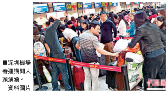
■深圳機場春運期間人頭湧湧。 資料圖片

深圳機場方面回應記者時則表示，新會展中心選址何處，目前還未有定論。現有的A、B候機樓面積約15萬平方米，既有空間格局是否滿足會展用址還需論證及規劃，也另有建議將這兩處候機樓改造為大型商業中心。