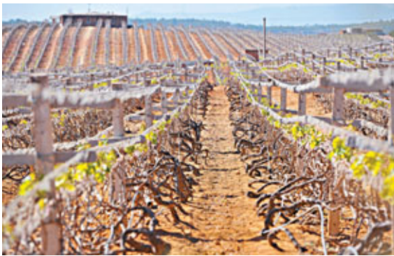
■目前雲南全省作物受旱面積達511萬畝，有60萬城鄉居民出現不同程度飲水困難。

國家防總綜合分析降水、江河來水、水庫蓄水及土壤墒情等多種因素後認為，去年發生嚴重旱情的西南和長江中下游部分地區今年春旱形勢仍然不容樂觀，部分地區可能再次出現連春連旱；北方冬麥區整體上旱情形勢好於常年同期，但陝西、甘肅、河南、山西等省部分地區灌溉條件較差的耕地墒情不足，旱情有