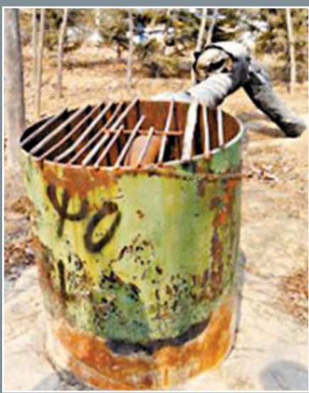
■網曝山東企業將污水通過高壓水井壓至地下1,000多米的水層。網上圖片