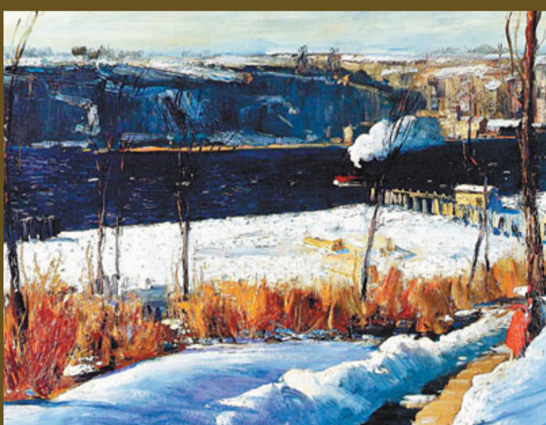
■ Winter afternoon Riverside Park, New York City. (1906)