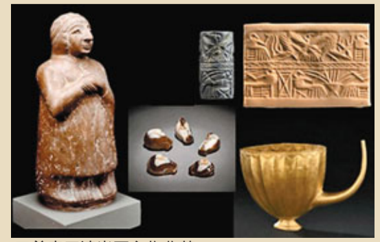
■美索不達米亞文物收藏。

展品包括最早期楔形文字的泥板(公元前3300年至公元前3000年)，在商務及法律文書中使用的精美圓柱形滾印，各式各樣大小不同的政治及宗教雕