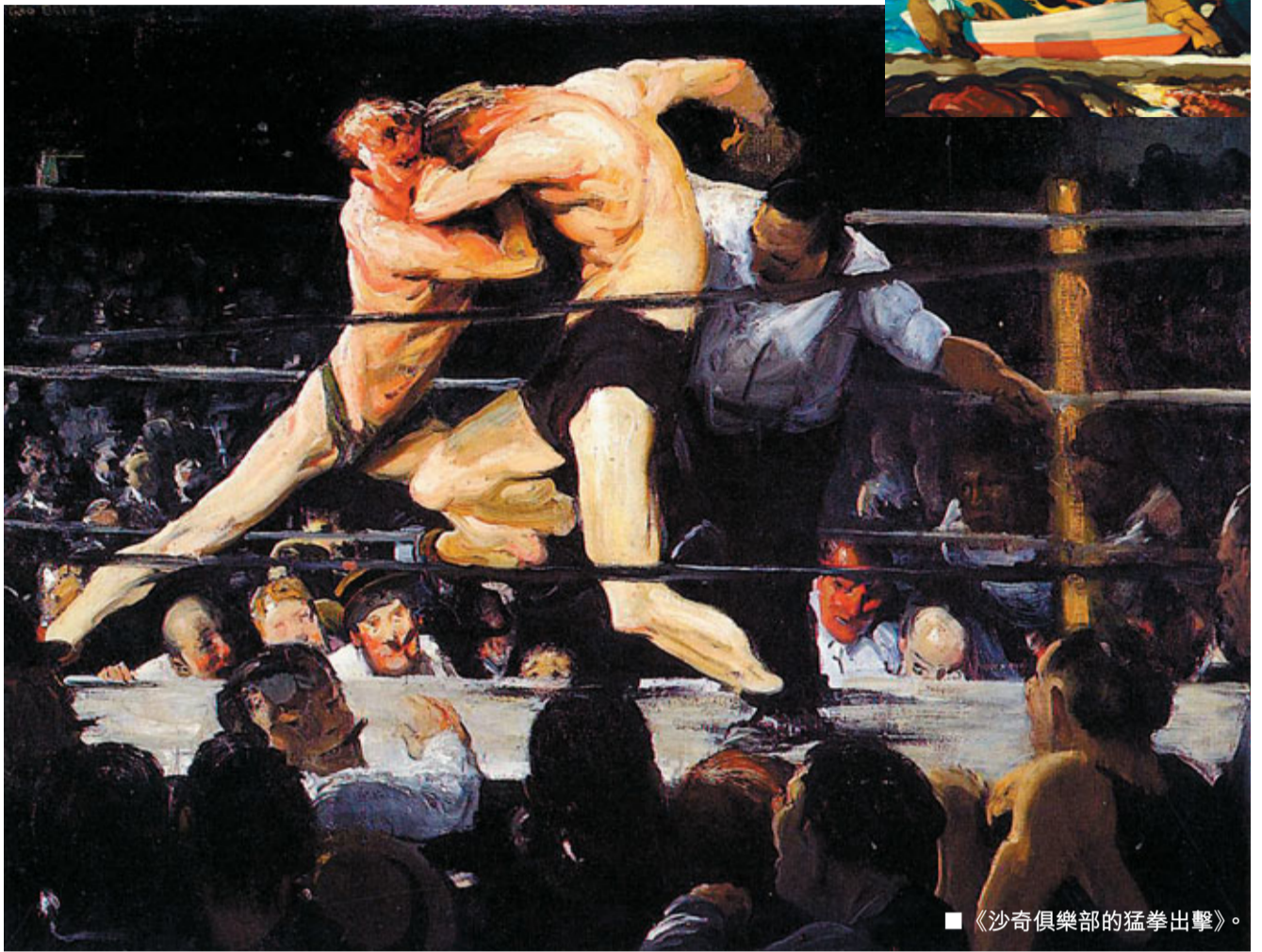
■ 《沙奇俱樂部的猛拳出擊》。

「垃圾箱畫派」(Ashcan School) 是美國現實主義繪畫的重要流派，與美國的學院派和美國印象派抗