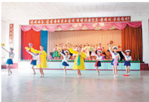
■ 被安排參觀學校的表演。