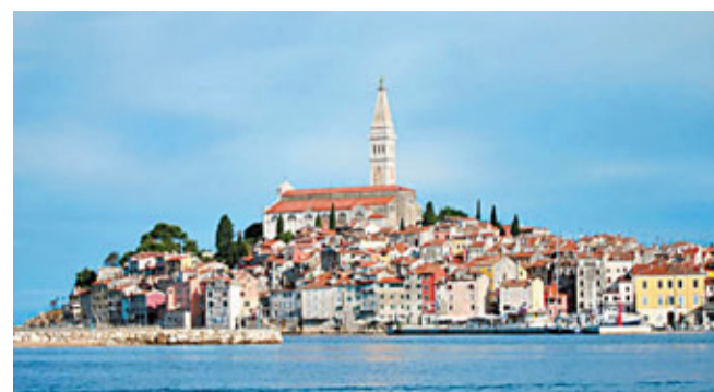
■ 克羅地亞是一個陌生中帶點唯美色彩的歐洲國家。