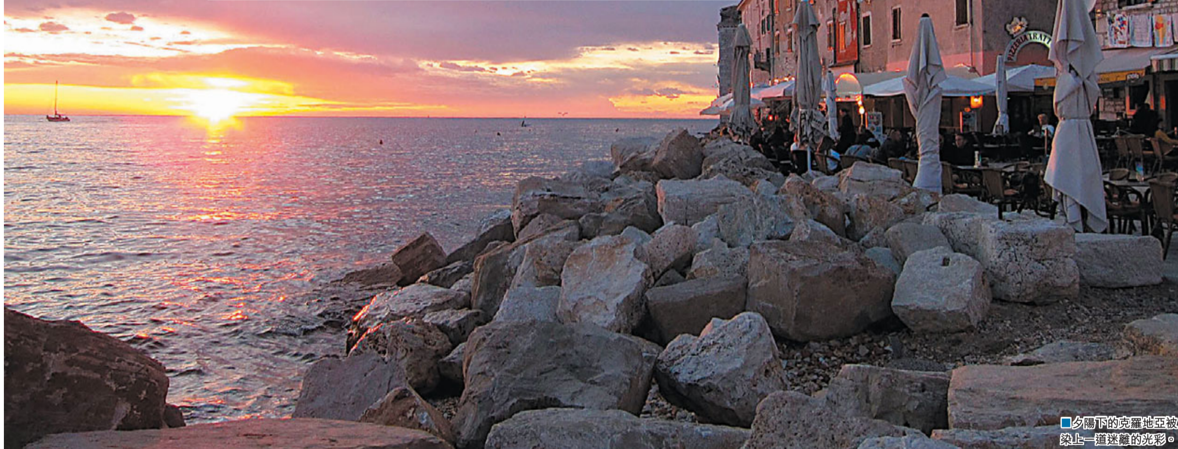
■ 夕陽下的克羅地亞被染上一道迷離的光彩。

逢星期二晚上九時於TLC旅遊生活頻道播放（有線電視54台、now寬頻電視213台、bbTV 317台）。