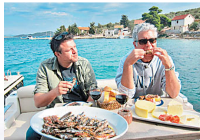
■ 主持人波登在品嚐海鮮大餐。