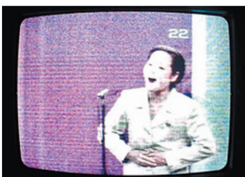
■ 酒店電視只有一個台，內容單調，好悶呀！