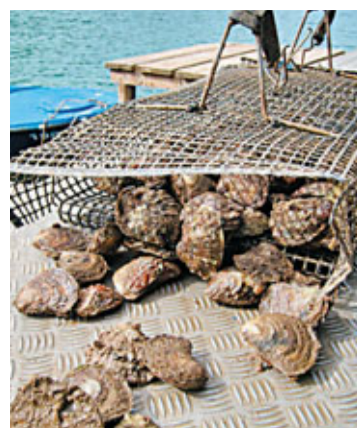
■ 當地養殖場現撈的生蠔十分新鮮肥美。

距離本島只有短暫船程的帕格島從外觀看來很像月球的表面，島上種植了千年橄欖樹。很久以前，威尼斯人曾在克羅地亞砍樹開路，建造威尼斯城堡。這一區相對來說比較安靜悠閒。居民以生產乳酪和羊肉為生，他們自己釀酒，過着自給自足的生活。後來觀光客漸多，才漸漸變成派對島，沙灘上開始躺滿享受日光浴的旅客。位處山上的波什克納酒店除了可以俯瞰島上風光，更提供全克羅地亞最具特色的美食，如陶鍋燉章魚和燉羊肚等，用料十分地道，取自附近一百五十公尺範圍內的食材烹調而成。波登斷言，愛吃意大利菜的人一定會愛上這裡的克羅地亞菜。