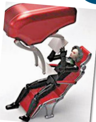
新設計讓乘客有更多私人空間。

客向後倚，後排乘客不僅空間大減，亦難以使用椅背的電視和餐枱，非常不便。他因此靈機一觸設計AirGo，去年贏得英國發明家協會頒發的馬來西亞詹姆斯戴森獎。