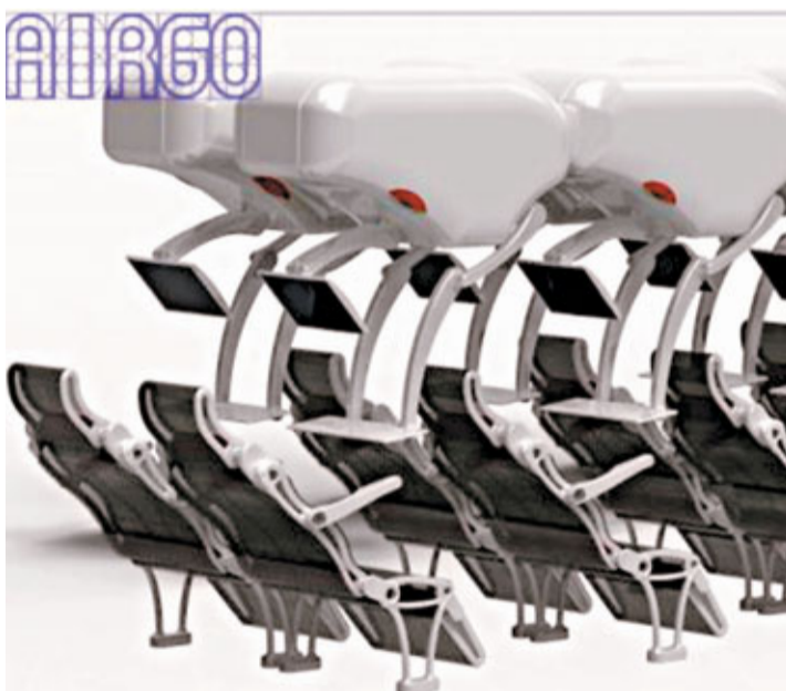
經濟艙新座位設有懸掛式電視及餐枱。