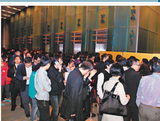
■葵涌「雍澄軒酒店」拆售當晚吸引1,000人到場輪候購買。