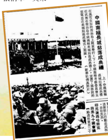
■本報當年2月23日第二版圖片報道此事。資料圖片

地考察事業已發展到新階段。同年3月20日，中國南極長城氣象站被世界氣象組織納入全球氣象台網站，並被正式授予國際台代號。本報在當年2月23日第二版以圖片形式予以報道。