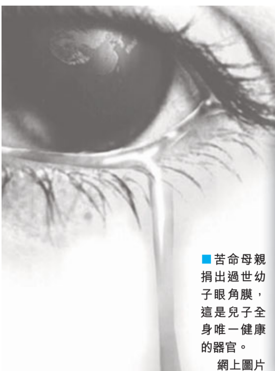
■苦命母親捐出過世幼子眼角膜，這是兒子全身唯一健康的器官。網上圖片