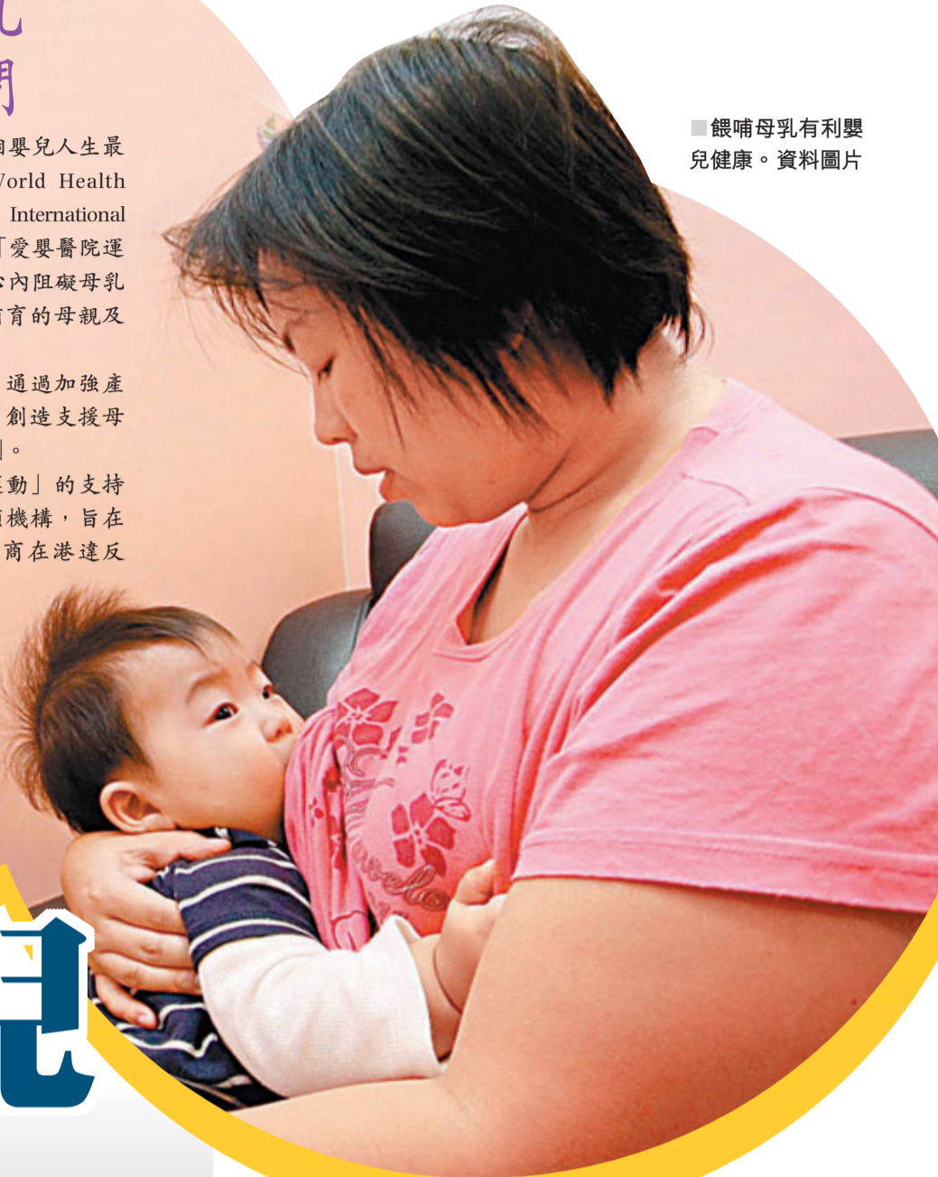
■ 餵哺母乳有利嬰兒健康。資料圖片

在香港，隨着本地醫院和母嬰健康院對「愛嬰醫院運動」的支持與日俱增，愛嬰醫院香港協會在1994年正式註冊為志願機構，旨在保衛和提倡母乳餵養，持續監察並檢舉嬰兒食品製造商在港違反《國際母乳代用品銷售守則》的情況。