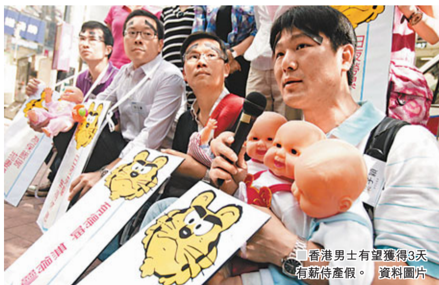
香港男士有望獲得3天有薪待產假。