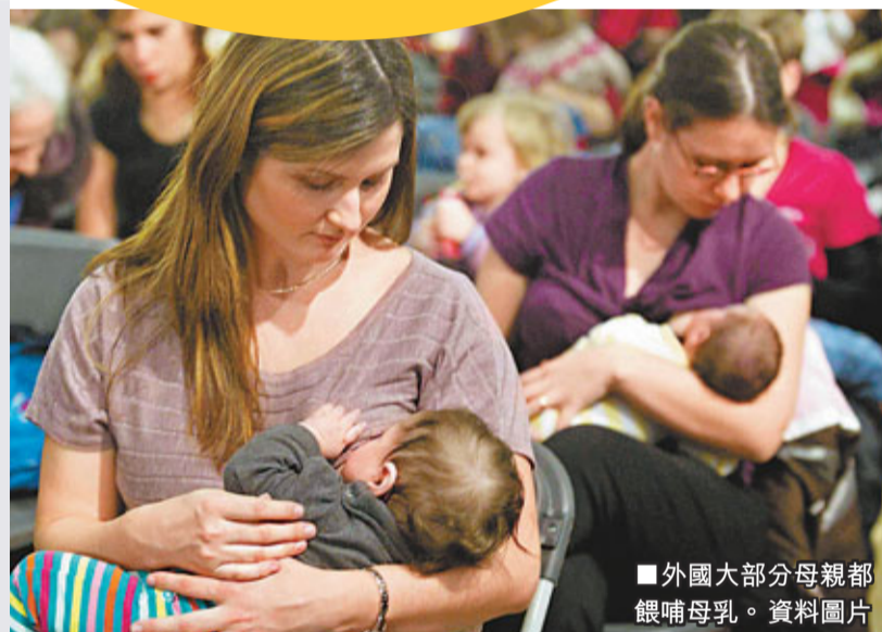
■ 外國大部分母親都餵哺母乳。資料圖片