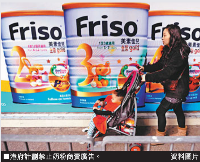
■ 港府計劃禁止奶粉商賣廣告。資料圖片

最後，除外界因素外，當前不少女性的愛美心態也影響其哺乳願望。主要是部分母親有錯誤認知，如怕哺乳影響體形，造成乳房下垂、變形等，因此拒絕哺乳。但大部分母親在母愛的巨大力量下，不會只因上述考慮而拒絕哺乳，香港各大公立醫院也不斷宣傳，告知懷孕婦女母乳餵養的好處，有助產後子宮和身材恢復。