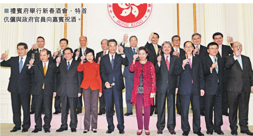
禮賓府舉行新春酒會，特首伉儷與政府官員向嘉賓祝酒。

他希望，未來會繼續維持這個做法，希望能夠成為一個傳統：「就是在我們遷入禮賓府後，盡量將禮賓府與大家分享，與民共享，與民同樂。」