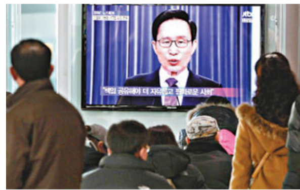
電視播放李明博的講話片段。

即將離任的韓國總統李明博，昨早在青瓦台春秋館發表卸任演說，稱5年執政期的功過交由歷史評價，並強調韓國已非邊緣小國，而是世界的中心國家，今後會繼續向前發展。