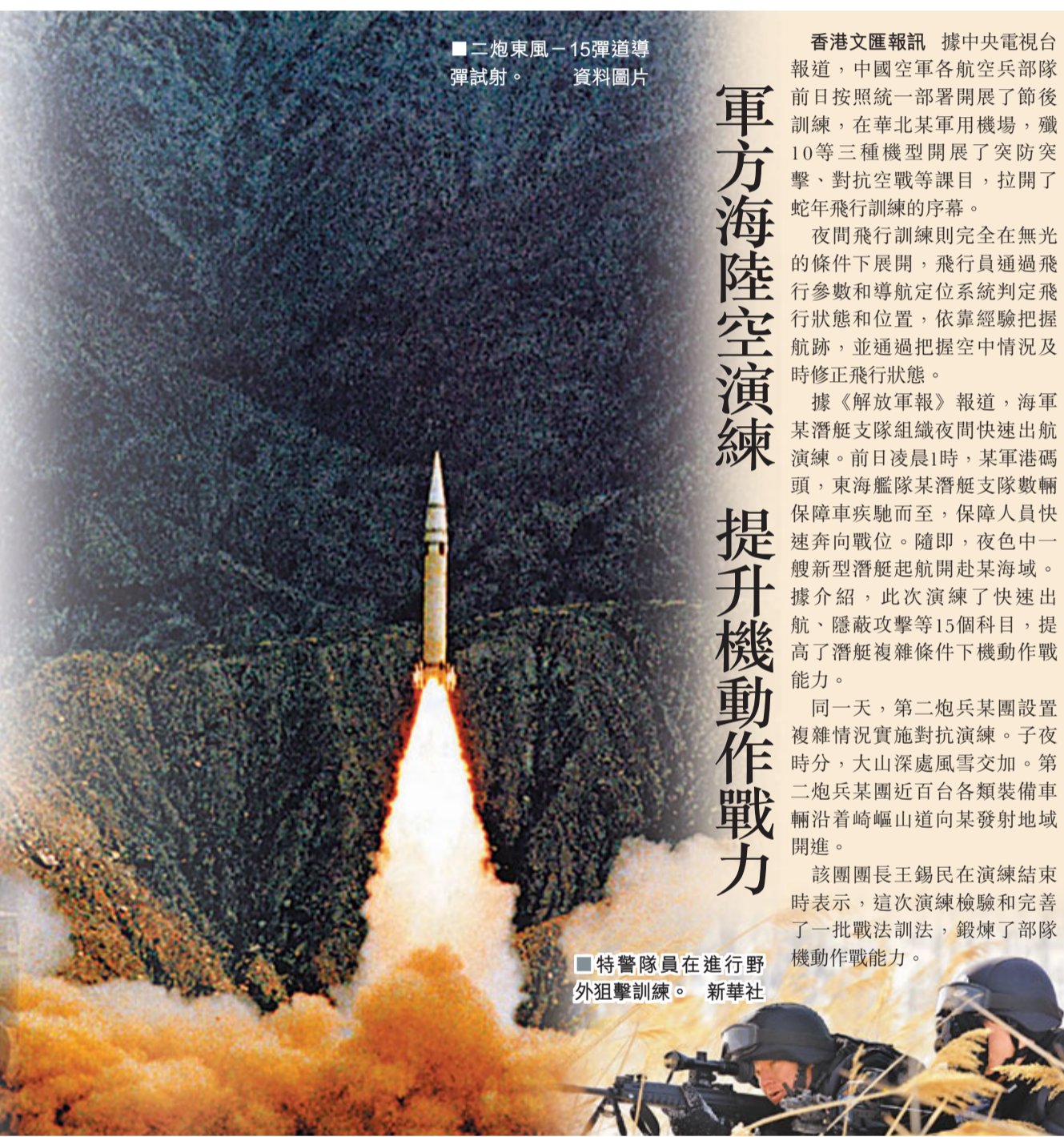
二炮東風-15彈道導彈試射。資料圖片