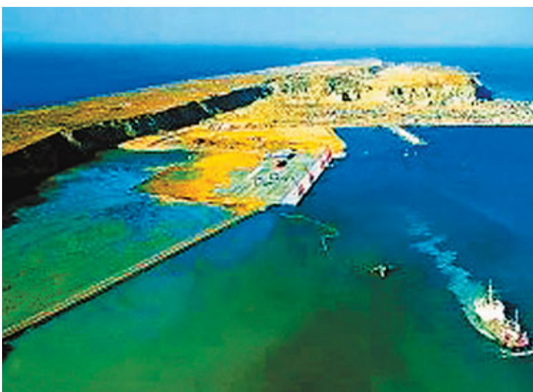
瓜達爾港毗鄰巴基斯坦和伊朗邊界,靠近霍爾木茲海峽,戰略位置重要。資料圖片

有分析認為,來自中東和非洲的商船也可以直接停靠在瓜達爾港,將石油、天然氣和其他商品經由巴基斯坦運抵中國。一旦陸上交通問題得到解決,瓜達爾港可直接用於向中國西部地區運輸石油和天然氣,這將削弱美國在阿拉伯海域的影響力。