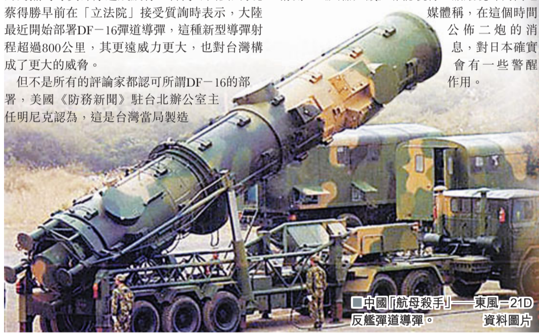
中國「航母殺手」——東風-21D反艦彈道導彈。資料圖片