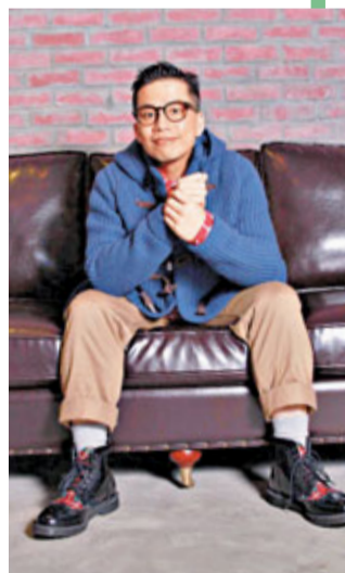
小肥憑《一首歌》感動人心。

怪德國哲學家黑格爾提醒我們，陳述才是評價的最高層次，而不是判斷本身。小肥在台上表示，Mr.可能比他更希望《一首歌》獲獎，筆者看到不只是「一首歌」、一個獎項，而是一份努力、一段友誼，歌手間除競爭，還有大愛。如果歌手站在台上只想成為大將，執著於成與敗，又如何贏得尊重，尊重從來不依靠能力，而是一副大善身段，硬把公平公正成為論據，不如開懷面對，一次得失對一名歌手來說，從來不是歷史論英雄的依據所在。大家不是常言喜歡音樂嗎？音樂從來沒有得失的角度，唱着一首歌，其實已是一種幸福。