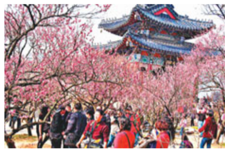
每年3月初春，江蘇南京東郊梅花山迎來賞梅高峰。

香港文匯報訊(實習記者 孔熹微 南京報導) 南京市一年一度的國家級大型旅遊節慶活動中國南京國際梅花節將於2月20日至3月31日舉行。本屆梅花節也是2013南京文化旅遊節啟動後「春之篇」的首場活動，將着力創新辦節理念和形式，以「魅力南京、百姓節日」為主題。據悉，現在的梅花山面積已達1533畝，梅樹3萬5千餘株，品種350多個。目前「南京早紅」、「單瓣早白」、「紅冬至」等早花品種都已陸續開放。到2月20日梅花節開幕時，梅花山梅花將進入初花期。而隨着溫度的逐漸回升，更多品種的梅花會在2月底到3月初集中綻放，呈現出花海如潮