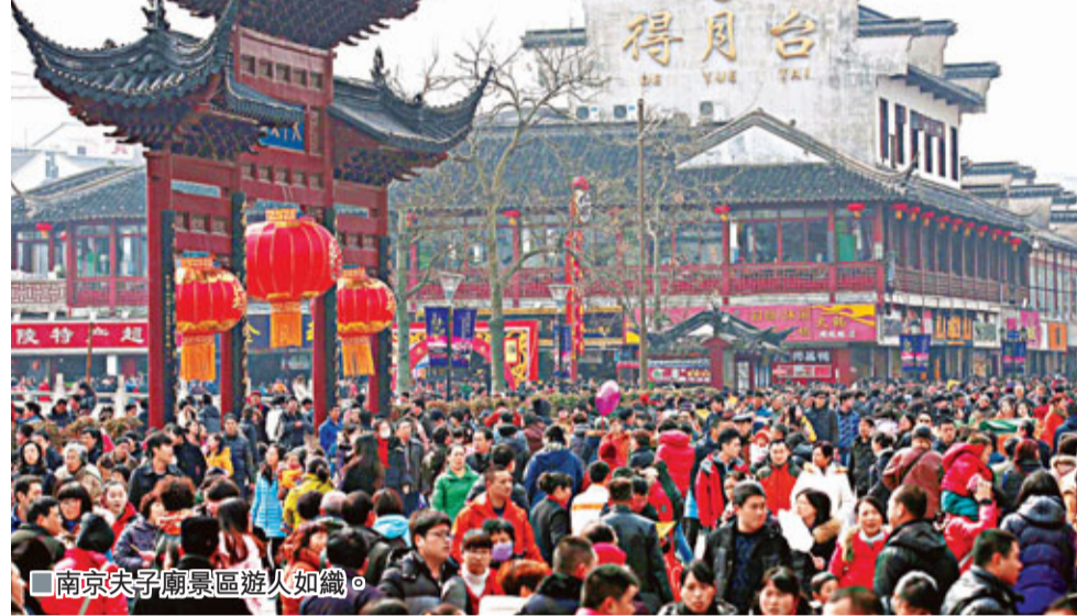
南京夫子廟景区遊人如織。

香港文匯報訊(記者 陳曉平 上海報導) 長三角旅遊發展研究中心日前發佈《長三角旅遊發展報告(2011—2012)》稱，國家支持及區域聯動下，長三角地區旅遊經濟風生水起，去年遊客接待量佔全國近四分之一，旅遊總收入佔全國近三分之一，約為八千億。其中，江蘇、浙江、上海兩省一市旅遊總收入名列全國前茅，整體實力居全國之首。