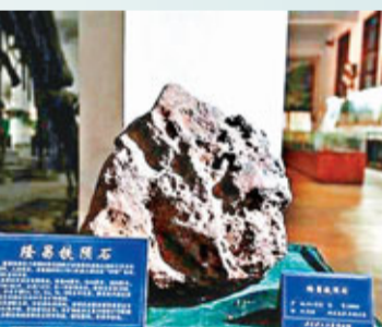
現藏於成都理工大學博物館的明代隕石。

香港文匯報訊(沈瑋 成都報導) 一塊隕石2月15日早晨墜落在俄羅斯烏拉爾山脈地區，引發爆炸，造成千餘人受傷，成為全球焦點。其實，早在五六百年前明朝就有隕石造訪了四川隆昌，重達158.5公斤，是目前已知最大的隕石，現陳列在成都理工大學博物館內。經專家鑒定，這塊隕石主要成分是鐵鎳合金，含量高達98%以上，幾乎是一塊純鐵。它的外形呈圓錐體狀，高46厘米、長44厘米、寬20厘米，卻重達158.5公斤，頂部表面較光滑，中後部佈滿近300個凹坑。成都地質學院專家們對隆昌鐵隕石進行了詳細研究。隆昌鐵隕石有個顯著的特點：磁性很強，有明顯的兩極性。地質學家范良明分析，「其原因估計是鐵隕石經大氣層墜落地面過程中，沒有發生翻滾、旋轉等方向上的改變，被地球南北極磁場磁化的結果。」隆昌鐵隕石的隕落時間太過久遠，沒有人知道它究竟來自何方。