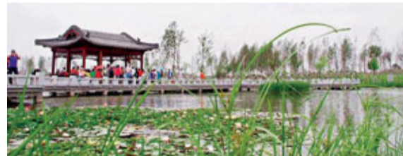
濕地公園對環境保護有重要作用。

香港文匯報訊(記者 蘇志堅 長春報導) 記者從吉林省林業廳獲悉，從2007年至今，吉林省已建設國家級濕地公園(試點)10個，恢復城市濕地面積9131公頃。其中長春市伊通河下游新建的長春北湖國家濕地公園總面積1,182公頃，目前已累計投入資金10億元，形成湖面200多公頃，建設路橋30多座，修建道路6.8公里，種植喬灌木7.5萬多株。該省還建立了大安嫩江灣、扶余大金碑、榆樹老干江、梅河口市磨盤湖、大石頭亞光湖、大安牛心套保、遼源礦山、鎮賚環城、東遼離鷺湖等國家級濕地公園。根據規劃，吉林全省每個城鎮至少建設1處濕地公園，力爭50%的縣城實現一城一園，濕地公園在調節氣候、美化城鎮環境、促進城鎮經濟社會發展中將進一步發揮重要作用。