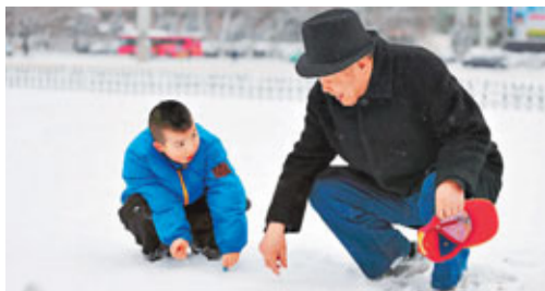
2011年地區發展與民生指數，甘肅省以9.91%的增速位居全國各省市首位。圖為祖孫倆在蘭州市東方紅廣場上玩雪。

香港文匯報訊(記者 肖剛 蘭州報導) 國家統計局日前公佈了2011年地區發展與民生指數報告，最新的數據顯示，甘肅省以9.91%的增速位居全國各省市首位。地區發展與民生指數的英文簡稱為DLI (Development and Life Index)，作為科學發展理念指導下的一項反映地區發展與民生改善狀況更科學、合理的指標，DLI的發佈讓衡量地區發展的標準進入了後GDP時代。