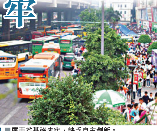
■ 廣東省基礎未牢，缺乏自主創新。

至於廣東，廣東省統計局指出，新的經濟增長動力有待繼續培育，戰略性新興產業從投入到形成大規模的生產能力需要幾年時間。此外，創新能力仍待加強。廣東華南經濟研究院區域與產業經濟研究所所長楊久炎指出，創新人才缺乏和創新環境欠佳是制約廣東自主創新的兩大問題。廣東現有的院士數量遠遠少於京、滬、蘇等省市。廣東人才培養質量、人才規模與經濟總量和結構不相稱。政府在完善科技投融資體系、促進創新資源共享交流機制、促進創新成果轉化政策等軟環境方面也相對滯後。