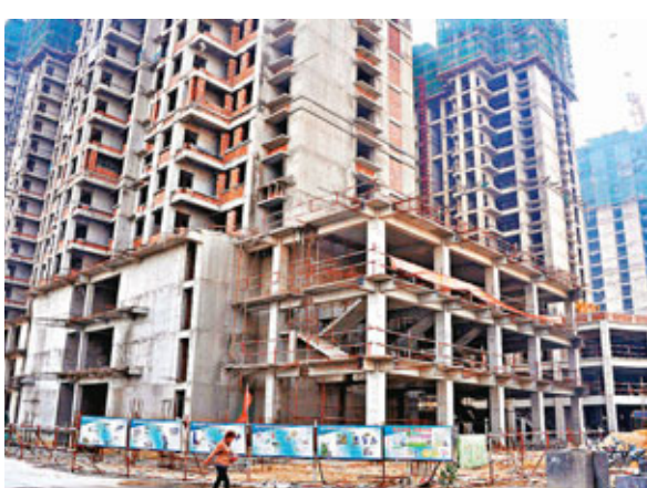
數以千萬套計的保障性住房建設，帶動建材、水泥、建築機械等需求。

另一方面，作為兩會關注的民生重要內容，保障房建設將倍加重視，去年內地基本建成保障性住房601萬套，開工建設781萬套；而今年新開工保障性住房600萬套，加上去年近800萬套，共有1,400萬套保障性住房建設，將會帶動建材、水泥、建築機械等需求。