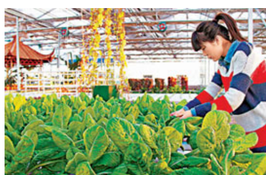
「家庭農場」首次在中央一號文件中出現，為農業股帶來利好憧憬。

有市場人士認為，如往昔一樣，本次兩會仍會聚焦農業、農村和農民的「三農」問題。加上今年「中央一號文件」提出鼓勵和支持承包土地向專業大戶、家庭農場、農民合作社流轉，而「家庭農場」的概念也是首次在中央一號文件中出現，為農業股帶來利好憧憬。