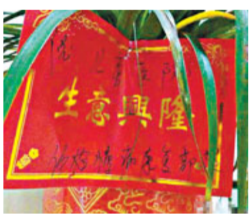
這個花籃橫幅下款寫着「體檢慢病康復部贈」。 網上圖片

湖南 瀘陽市一所兒童醫院近日被網友發現走廊上掛有「生意興隆」、「開業大吉」等春節橫幅，引發了不少網友感慨，「醫院要『生意興隆』，這意味着什麼？是希望比別的醫院生意好、收入多？還是希望生病的患者越來越多？」對此，當事醫院向公眾道歉，解釋說是因工作疏忽、不嚴謹，直接使用了花店「固定模板紙」，這樣的橫幅確實不妥，並保證今後不再發生類似的事。