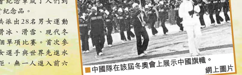
中國隊在該屆冬奧會上展示中國旗幟。

的中國奧委會紀念章成了人們到處索求的珍貴紀念品。當年中國共派出28名男女運動員，參加了滑冰、滑雪、現代冬季兩項的18個單項比賽。首次參賽的中國男女選手與世界先進水平有較大差距，無一人進入前六名。