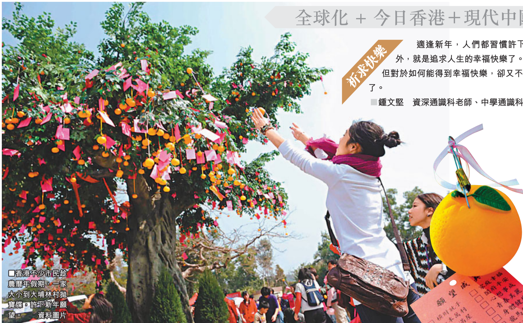
香港不少市民趁農曆年假期，一家大小到大埔林村拋寶碟，許下新年願望。