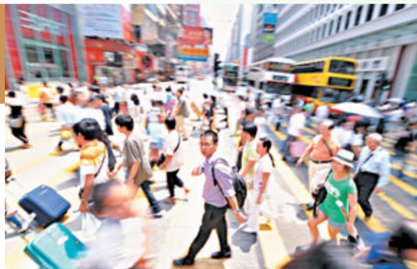
已發展國家和地區大部分的人與人之間關係疏離。

單看設計的問題可見與城市人生活格格不入：因為謀生的壓力，經常睡眠不足；日常生活忙碌緊張，難得慢下來感受生活的樂趣；熱心腸最常碰到冷臉，人與人關係疏離；以上皆是城市人生活的籠統寫照。