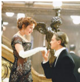
電影內的鐵達尼號船艙裝潢豪華。

藍星航運還表示，將舉行大型環球活動以緬懷原鐵達尼號和慶祝鐵達尼二號，澳門為活動首站。