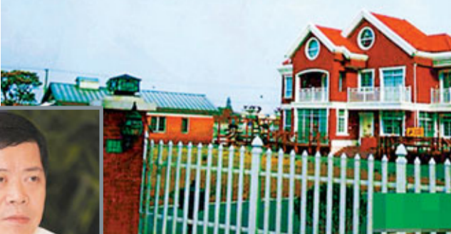
網傳上海浦東新區副區長陸鳴(小圖)所居住的「2600平方米別墅」。