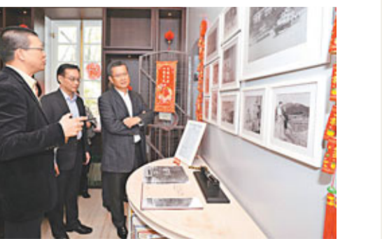
陳茂波(右)參觀大澳文物酒店。

陳茂波其後分別在東涌西和東兩個地點,從高處眺望區內發展,並聽取了西貢及離島規劃專員鍾文傑匯報當區的規劃,包括東涌第三十九區的