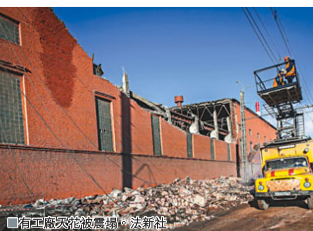
工廠天花被震塌。