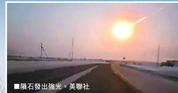
隕石發出強光。