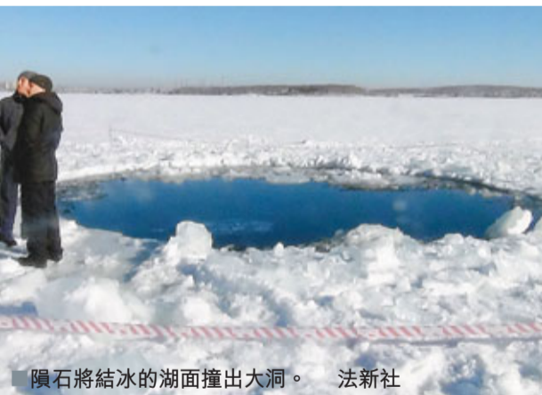
隕石將結冰的湖面撞出大洞。法新社