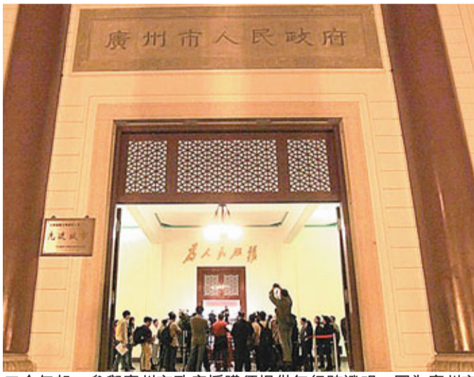
今年起,參與廣州市政府採購須提供無行賄證明。圖為廣州市政府。

此規定從1月1日起生效,是廣州為加強政府採購市場監管,培育公平競爭的政府採購市場競爭環境而制定。據了解,根據中國現行的《政府採購法》第23條規定,採購人可以要求參加政府採購的供應商提供有關資質證明文件和業績情況,並根據本法規定的供應商條件和採購項目對供應商的特定要求,對供應商進行資格審查。