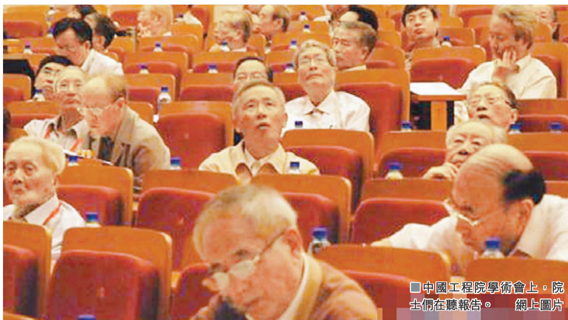
中國工程院學術會上,院士們在聽報告。

消息人士指出,目前,高層次創新型青年科技人才隊伍正逐步壯大,百千萬人才工程國家級人選已超過4,000人。而改進完善院士制度,已被寫入中央出台的《關於深化科技體制改革加快國家創新體系建設的意見》中。該項工作正由中科院牽頭,會同中國工程院、教育部、科技部共同承擔,並將「保持院士稱號的學術性和榮譽性,不與物質利益掛鉤」作為首要原則。