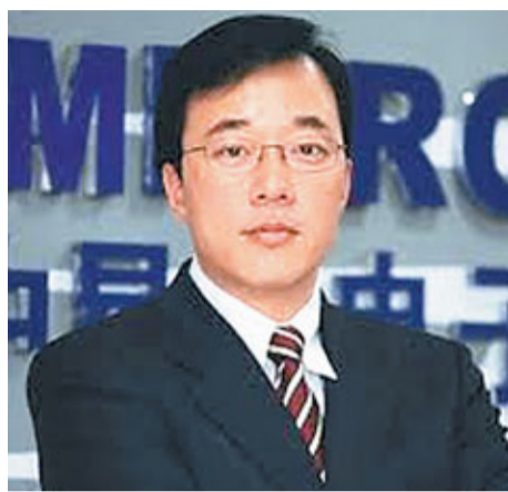
45歲的鄧中翰是中國工程院最年輕的院士。

李俠又指出,近年來,兩院新院士增選工作已注意到老齡化問題,出現可喜現象。以2009年為例,新當選的中國科學院院士平均年齡54.1歲,比2001年降了6歲。新當選的中國工程院院士平均年齡56.2歲,比2001年降了7歲。「預計在2013年兩院院士增選中,新當選的院士年齡應在55歲左右。未來應加大兩院院士中45-65歲之間