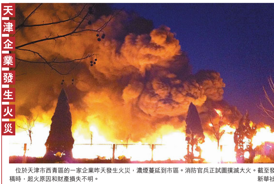
位於天津市西青區的一家企業昨天發生火災,濃煙蔓延到市區。消防官兵正試圖撲滅大火。截至發稿時,起火原因和財產損失不明。

專家指出,在政府持續進行樓市調控的情況下,中國房地產暴利的時代早已終結,坐等房價上漲或依賴城鎮化推動市場並不現實,房地產企業應進一步細分市場,合理設計利潤空間。