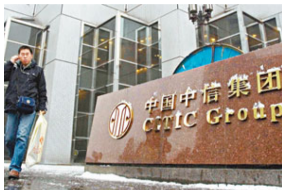
中信集團將會購入Alumina股權5.2%。資料圖片

香港文匯報訊（記者 陳遠威、黃詩韻）外電報道，中信資源（1205）與母公司中信集團將斥資4.52億澳元（約36.3億港元）入股澳洲大型鋁精煉企業Alumina。Alumina將向中信資源配售新股，認購價為2.712億澳元（約21.8億港元），計劃認購7.8%的Alumina股份，而中信集團將購入Alumina股權5.2%。中信資源昨發通告指，認購價較Alumina股價1.2澳元