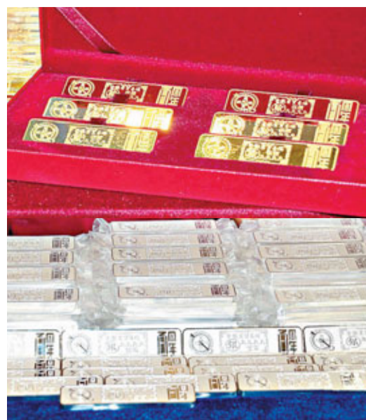
新推出的五兩金條及銀條。