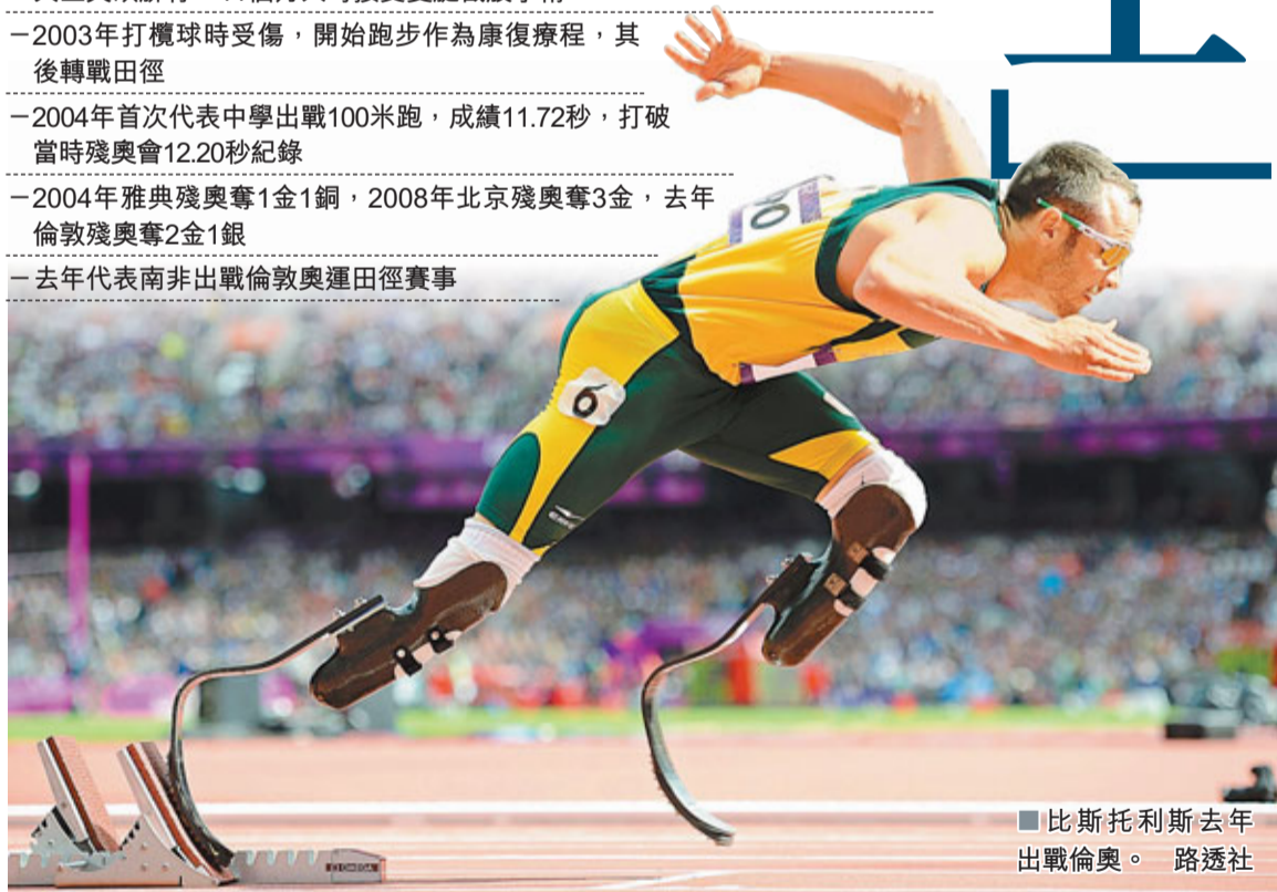
比斯托利斯去年出戰倫敦。