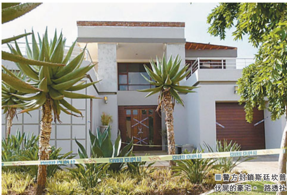
警方封鎖斯廷坎普伏屍的豪宅。