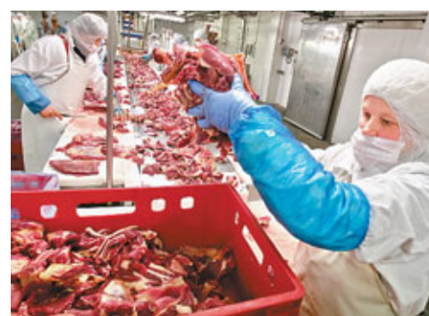
馬肉(見圖)冒充牛肉的醜聞在上月15日曝光，Findus品牌的冷凍牛肉千層麵上週更被發現肉碎中含60%馬肉，隨即在歐洲全面下架。希思表示，在英國下架的Findus產品並無發現含保泰松。

歐洲「馬肉醜聞」鬧大，英國政府昨公布在運往法國的馬肉中，發現可能對人體有害的藥物保泰松(phenylbutazone)，或已進入食物鏈。德國一家超市亦發現在已下架的Findus冷凍牛肉千層麵中發現馬肉成分。