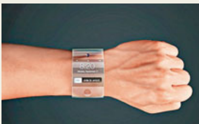
網上流傳的兩款iWatch圖片。

據兩名消息人士透露，蘋果公司一組由近100名產品設計師組成的團隊，正精心打造類似手錶的裝置，將可用作執行iPhone與iPad的部分功能。匿名消息人士指，團隊成員包括經理、行銷團隊成員及早前全力打造iPhone與iPad的軟體工程師等。