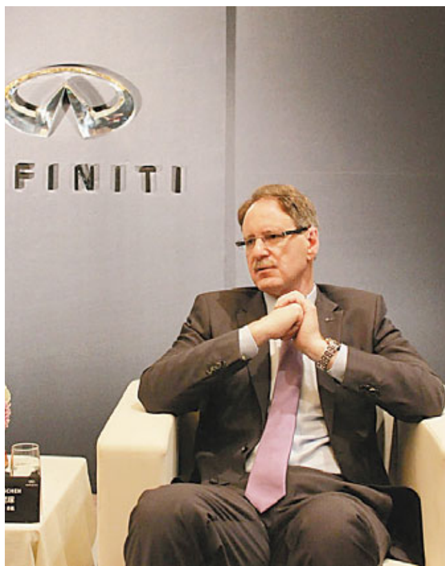
英菲尼迪總裁約翰·德·尼琛在京接受媒體訪問。

對於中日釣魚島爭端給日系車在華銷量的影響，約翰·德·尼琛表示影響並不大，但仍推遲了新車型的引入，這也是英菲尼迪2012年銷量受到影響的原因。而尼琛於此時出任新總裁，在被問及壓力時，他回應稱繼續對未來的銷售增長持積極預期，預計2013年在中國的銷量將實現兩位數增長。