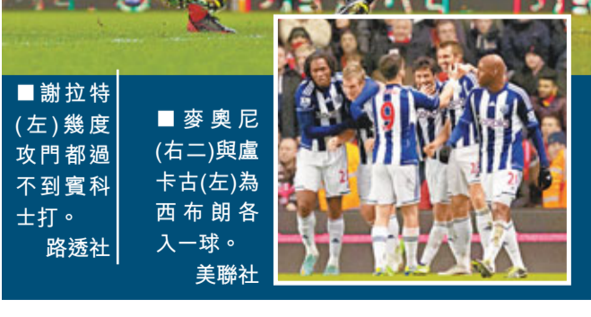
謝拉特(左)幾度攻門都過不到賓科士打。 麥奧尼(右二)與盧卡古(左)為西布朗各入一球。

另外，英超熱烈的30歲英格蘭國腳前鋒迪科爾，涉嫌與一宗恐嚇案有關被警方拘捕。據報，迪科爾的表親邀請了兩名女子到他家參加派對，迪科爾返家後發現價值20萬英鎊的衣履及飾物不翼而飛，着人找回該兩名女子，她們稱遭到死亡威脅，但恐嚇他們的不是迪科爾及其表親本人。