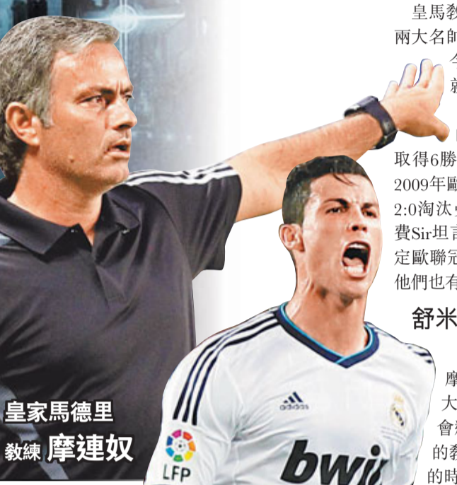
皇家馬德里 教練 摩連奴

費格遜是C朗的伯樂，2003年將他帶到奧脫福，在292仗中入了118球，之後以10億港元身價轉投皇馬，這位大熱大勇的葡萄牙鋒將至今179場中為皇馬入了182球，比率遠高於396場入308球的皇馬名宿迪史提芬奴。皇馬日前還獲得包括布達堅奴在內的4位皇馬前名射手拍片為C朗減壓兼打氣。