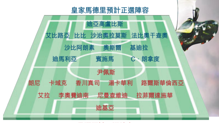
皇家馬德里預計正選陣容 曼聯預計正選陣容