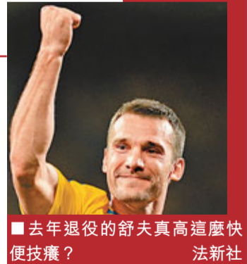
去年退役的舒夫真高這麼快便技癢？

早前轉戰政壇的前車路士球星舒夫真高(舒夫)有望回歸足壇。據消息指，在政壇失意的舒夫近期突然技癢，又再把精力重新投入足球上。雖然舒夫已年屆36，但曾效力基輔戴拿模、AC米蘭和車路士的他仍獲不少球隊垂青，其中印尼的米特拉庫卡已經對舒夫作出招攬，球隊老闆福贊在傳媒面前亦大方承認對這位老將甚感興趣：「我們對舒夫真高非常感興趣。現正進行談判，一些經濟上的細節還需協商。我們希望他能為球隊踢10場左右的比賽，至於薪水問題，我們相信可找到錢，把他邀請到印尼，這對印尼足球將是很好的促進。」