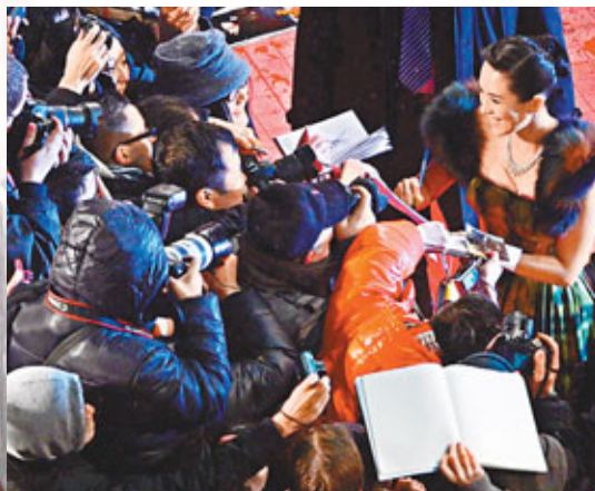
■章子怡親民為粉絲簽名。