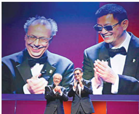
■王家衛和影展主席高戴亞達開幕禮上鼓掌。