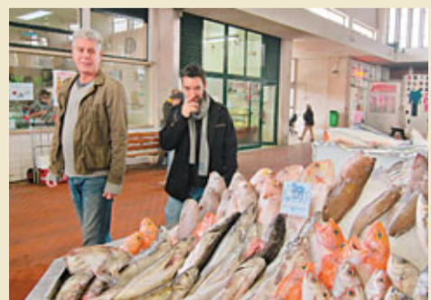
《波登不設限》最後一擊！