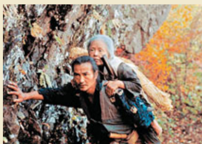
《楮山節考》裡，兒子背着阿鈴婆上楮山。