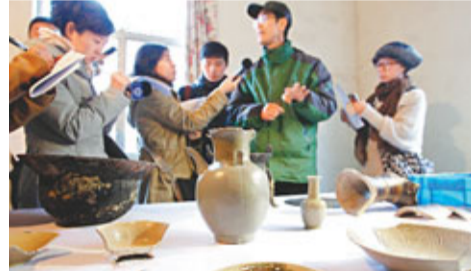
上海博物館首次公布位於青浦白鶴鎮的「青龍鎮遺址」二次考古發掘成果。

遺跡或為鑄鐵作坊 據悉，已發掘的作坊區分佈在方圓60米的範圍內，清理出排列有序的4座火爐，周圍堆積着大量的紅燒土鑄造殘渣，殘渣內包含有較多的陶範殘塊、爐渣等，最厚處有80厘米。初步確定，這裡是一處範圍較大、使用時間較長的唐代鑄造作坊遺跡，該遺跡可能為鑄鐵作坊，為上海地區首次發現。