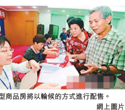
安居型商品房將以輪候的方式進行配售。 種創新型保障性住房類型。根據安居型商品房的申請條件，申請人只要具有深圳戶籍、繳納社保達到一定年限，在深圳市未享受購房優惠政策，未擁有任何形式自有住房的，且符合國家計劃生育政策的，不論其資產狀況或收入水準如何，均可申請參加輪候並購買一套安居型商品房。

據新華社6日電 據深圳市住房和建設局消息，深圳將於6月底前初步建立安居型商品房輪候名冊。 深圳市住房和建設局日前發佈《關於受理安居型商品房輪候申請建立輪候名冊的通告》，並於3月12日正式啟動安居型商品房輪候申請受理工作。