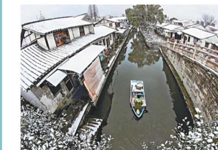
紹興 銀裝迎新春 受北方強冷空氣影響，浙江紹興市7日夜間普降入春以來首次春雪。雪後浙江紹興一片銀裝。