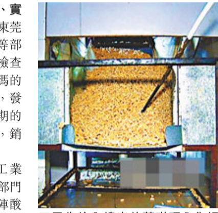
黑作坊內搜出的薩琪瑪全為過期回收品。 經過處理再加工而成，生產狀況堪憂。東莞高埗鎮工商、質監等部門執法人員已對其進行依法查處。

香港文匯報訊(記者李薇、實習記者何花東莞報導)廣東東莞市高埗鎮工商、質監、經貿等部門日前在進行食品安全生產檢查時，對一「秘密」生產薩琪瑪的黑作坊依法進行了聯合查處，發現這一黑作坊將市面上已過期的薩琪瑪回收重新加工成年貨，銷往廣深和周邊鎮街。