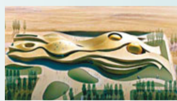
正在建設中的敦煌莫高窟保護利用工程遊客服務中心效果圖。

香港文匯報訊(記者朱世強蘭州報導)記者從敦煌研究院獲悉，經過4年的緊張施工，莫高窟保護史上規模最大、涉及面最廣的「敦煌莫高窟保護利用工程」預計今年10月全部完工。屆時，一個全新的「數字敦煌」展示和遊客服務方式將呈現在中外遊客面前。