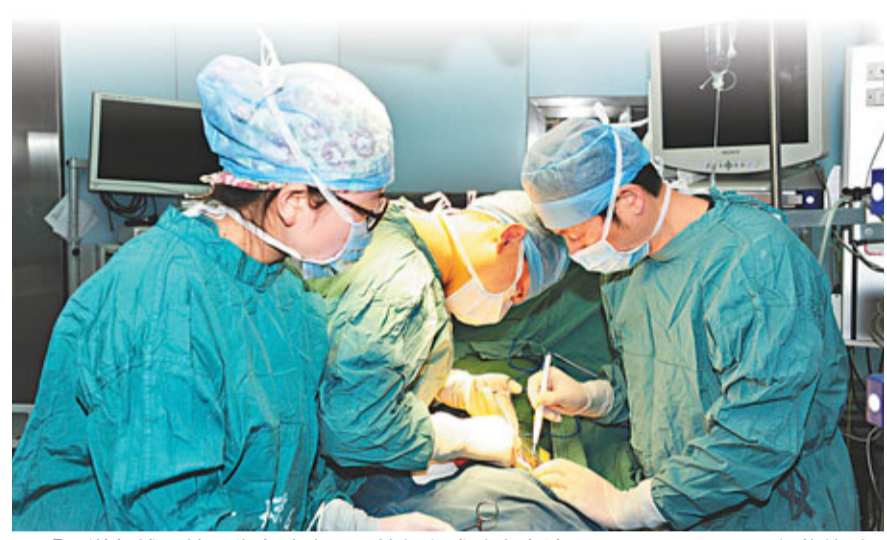
「腸道起搏器植入術」治療頑固性便秘成功率高達87%。

香港文匯報訊(記者熊曉芳西安報導)便秘是無形的腸道殺手，西安有一名年輕女子，5年多深受排便困難所困擾，由於長期服用瀉藥、減肥藥，結果導致症狀不斷加重，痛苦異常。記者從陝西西安第四軍醫大學西京醫院獲悉，該院消化病醫院日前成功在該名女子體內安裝了一個「腸道起搏器」，通過微弱電流刺激腸道蠕動。此技術的開展在內地尚屬首例，且治療頑固性便秘成功率高達87%。