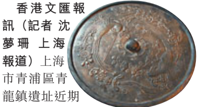
青龍鎮遺址出土的唐代鸚鵡銜鏡十分精美，實屬罕見。

香港文匯報訊(記者沈夢珊上海報導)上海市青浦區青龍鎮遺址近期出土了大量唐宋元時期的瓷器、銀、銅、鐵、木器等文物近2,000件，將上海作為興盛繁榮的對外貿易港口歷史從近代推到了唐代。