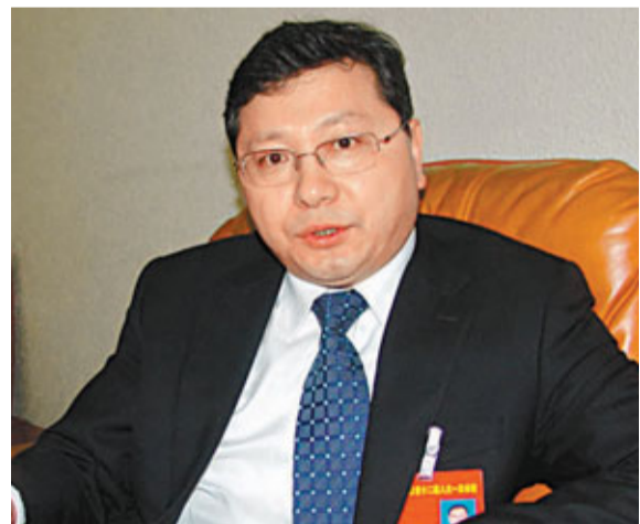
寧安市市長徐利刃接受記者採訪

第三,大力發展生態健康產業。寧安市有湖泊、溫泉、森林等100多處可供開發的旅遊資源,結合市場需求,寧安市將重點發展康居養生、遊樂養生、休閒農業等九大類生態健康項目。