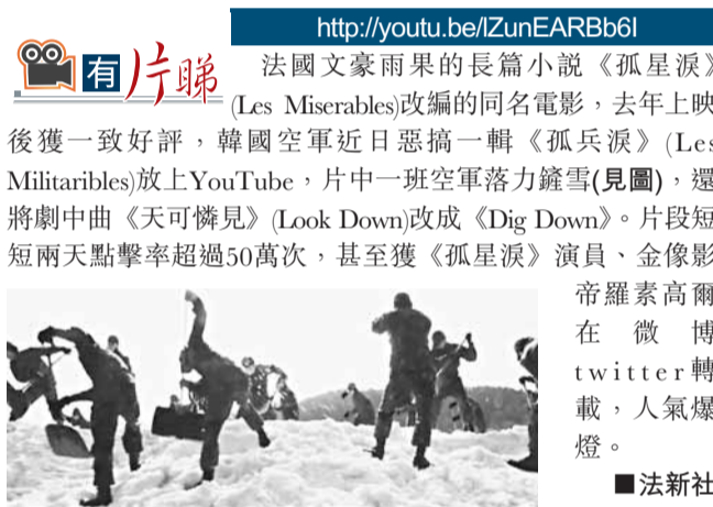
帝羅素高爾在微Twitter轉載，人氣爆棚。

法國文豪雨果的長篇小說《孤星淚》(Les Misérables)改編的同名電影，去年上映後獲一致好評，韓國空軍近日惡搞一輯《孤兵淚》(Les Militaires)放上YouTube，片中一班空軍落力鏟雪(見圖)，還將劇中曲《天可憐見》(Look Down)改成《Dig Down》。片段短兩天點擊率超過50萬次，甚至獲《孤星淚》演員、金像影帝羅素高爾在微Twitter轉載，人氣爆棚。