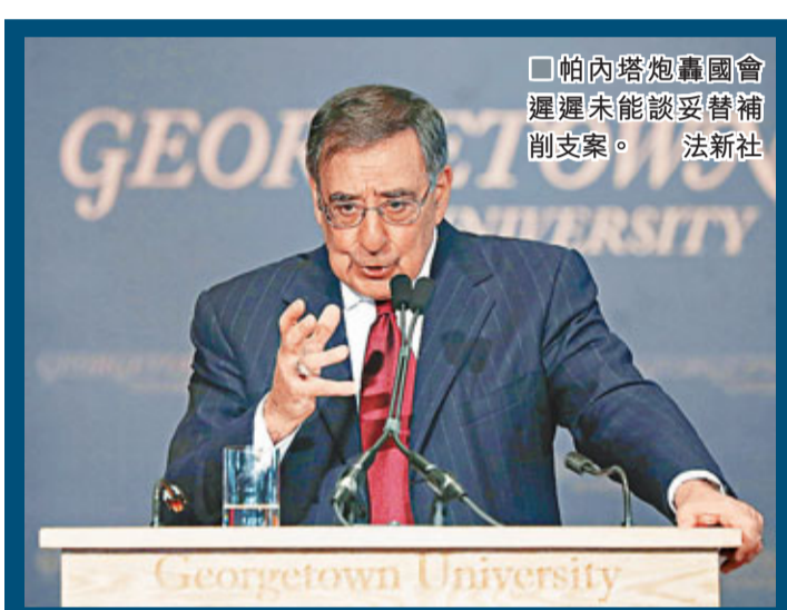
帕內塔炮轟國會遲遲未能談妥替補削支案。