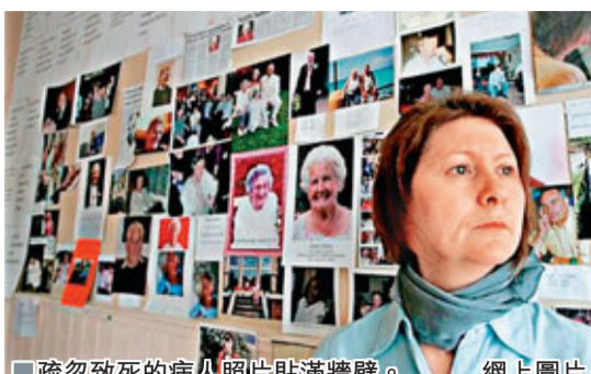
疏忽致死的病人照片貼滿牆壁。 網上圖片

英國廣播公司去年公布數據顯示，英國每年近3,000名患者死於非必要醫療過失，另有7,500人因誤診、接受錯誤藥物治療或看護服務差劣受到嚴重傷害。英國埃克塞特大學教授威廉斯表示，病人