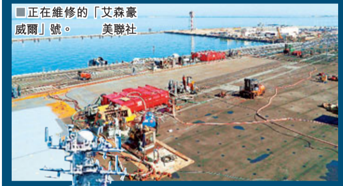
正在維修的「艾森豪威爾」號。