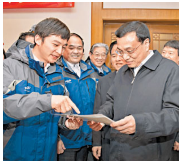
■李克強獲「蛟龍號」深潛員贈送海底生物圖片。 新華社

香港文匯報訊 據新華社報道，中共中央政治局常委、國務院副總理李克強昨日考察中國國家海域動態監視監測管理系統時說，堅決維護國家海洋權益，守護好每一片海域。