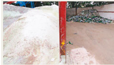
玻璃瓶(右)會壓碎成玻璃沙(左)，代替部分製磚的幼沙。