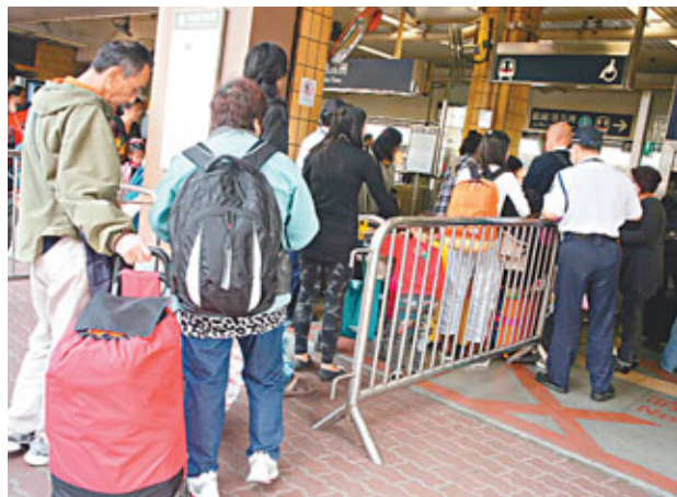
政府發表諮詢文件，建議修訂進出口規例，每名16歲或以上人士，限帶兩罐奶粉離境，以打擊水貨活動。