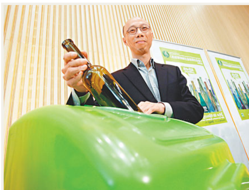
環境局局長黃錦星預計，本港玻璃樽飲品實行強制性生產者責任計劃後，可將回收率由現時的8.5%增至70%或以上。

香港文匯報訊(記者 羅繼盛)本港現時每日平均有250公噸廢玻璃樽被送往堆填區，其中飲品玻璃樽約佔三分之二，是都市固體廢物棄置量的2%。為減輕堆填區負擔，港府昨日就飲品玻璃樽生產者責任計劃發表諮詢文件，建議向飲品供應商徵費，每個1公升玻璃樽徵費約1元；同時以招標形式委聘玻璃管理承辦商，負責收集廢飲品玻璃樽和轉化成可重用物料，由徵費支付運作成本。當局今年會向立法會提交報告，預計明年提交草案，務求政策可盡快實施，預計將回收率由現時的8.5%增至70%或以上。