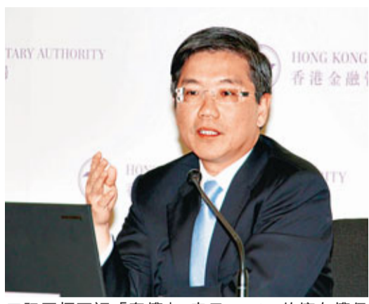
阮國恒否認「奪權」,表示HIBOR的擁有權仍歸銀行公會。

金管局副總裁阮國恒昨日於記者會上表示,在考慮財資市場公會報告和銀行公會的意見後,將推出一系列加強HIBOR定價機制的措施,要求兩個組織於6個月內實施多項優化措施,包括將拆息定價機制的管理職能交予財資市場公會,就管理人員工作制訂適當監管及管治架構,制訂詳盡操守準則,停止編制市場需求較少的拆息定價(4、5、7、8、9、10及11個月),及每12個月檢討報價銀行名單。