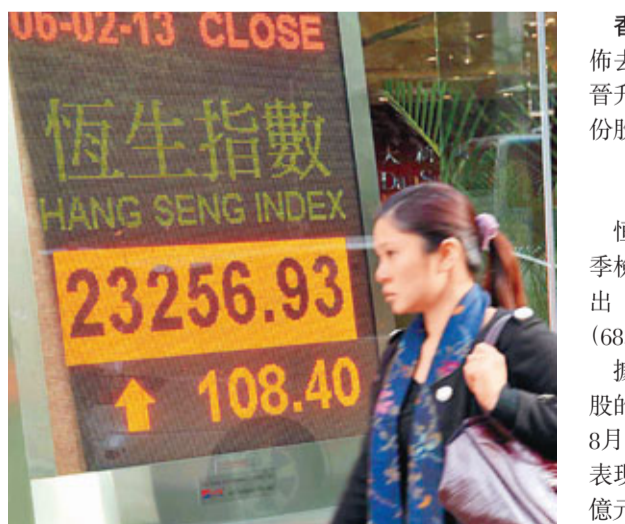
港股昨一度反彈206點,收市僅升108點,主板成交748億元。

香港文匯報訊(記者 卓卓安)恒生指數公司昨日宣布去年第四季度指數檢討結果,聯想集團(0992)再度晉升恒指成份股,而中國鋁業(2600)則被剔出恒指成份股,指數成份股總數維持50隻不變。