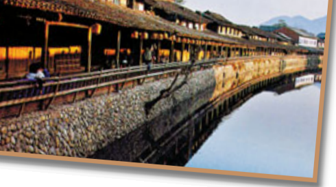
楓孤溪旅遊服務區效果圖