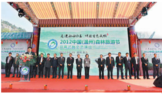
2012中國(溫州)森林旅遊節