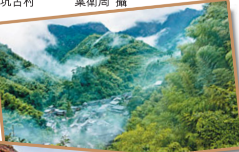
麗水古街