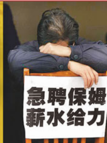
即便支付的工資高於平日一倍，「春節保姆」仍然是供不應求。網上圖片

薩蘭 (上海報道) 常年在外打工的保姆，新春佳節也要返家過年。在京滬等內地大城市均現「時令性」保姆荒，其中今年上海春節已返鄉保姆超七成，令主顧們大感頭疼。今年在上海的家政市場上，就有看準機會的土庫曼斯坦籍保姆閃亮登場。目前內地法律尚不允許以勞務輸入引進外籍保姆，有專家呼籲有限開放高端外籍保姆市場。