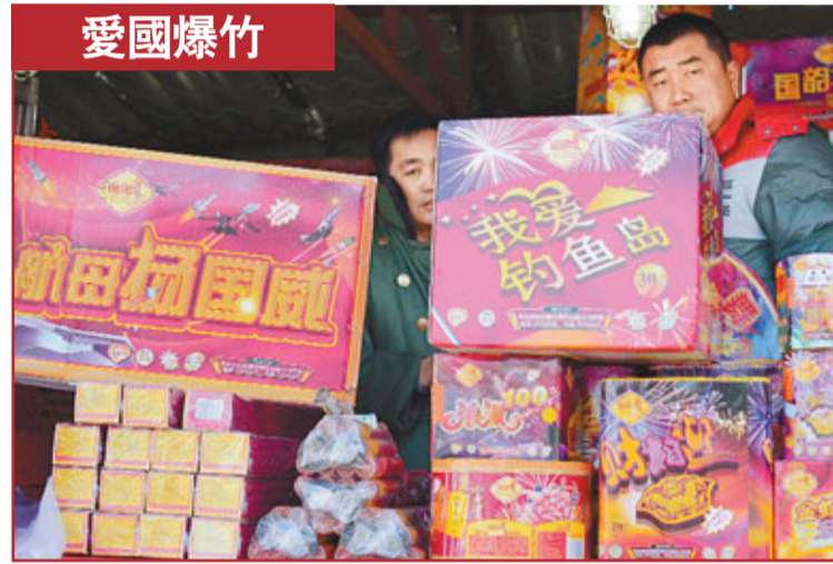
北京一處煙花爆竹銷售點近日將名為「我愛釣魚島」和「航母揚國威」的產品擺放在醒目的位置，以期吸引顧客。

的兩根輻條斷了，把布袋刮了個大口子。而幾乎是瞬間，4.3萬元現金也滑落在地上。當時風大，來往車多，錢瞬間被吹得到處都是。看到路過的人們紛紛停住腳步，有的還把自行車停下來撿錢，她開始心裡特急，撿錢的有七八個人，要是他們把錢裝進自己的口袋可怎麼是好。她回憶稱，撿錢的過程中，有兩名恰好路過的警察也來幫忙，一人維持秩序，一個幫忙撿錢，最後4.3萬元分文未少回到她的手中。