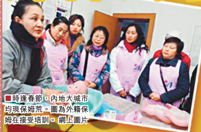
時逢春節，內地大城市均現保姆荒。圖為外籍保姆在接受培訓。