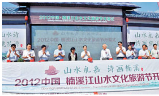
2012中國楠溪江山水文化旅游節開幕式

「永遠的山水詩，最後的桃花源」，楠溪江風景區以現代桃花源式的姿態，逐漸成為遊客心中對詩意般田園生活的寫照。 ■香港文匯報記者 鄭忠成、俞畫 實習記者 高施倩