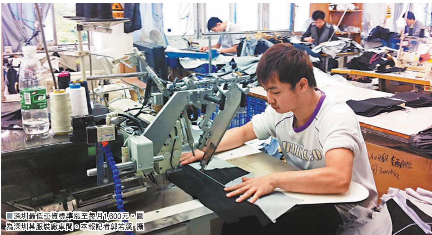
■深圳最低工資標準漲至每月1,600元。圖為深圳某服裝廠車間。

根據廣東省政府日前公佈的最低工資標準調整政策,廣州市企業職工最低工資1,550元每月,略低於深圳的1,600元每月。