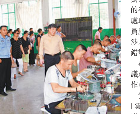
■雲南是中國最早建立勞動教養場所的省份之一。

雲南省政法書記孟蘇鐵5日宣布:「從現在起,雲南省對涉嫌危害國家安全、纏訪鬧訪、醜化領導人形象等三種行為的勞教審批全部停止。對其他違法情形的勞教審批全部暫停,依據相關法律進行處理,不再採用勞教手段。對目前在教人員應繼續執行、自然消化。原則上不受理涉及勞教制度歷史問題的上訪,確有執行錯誤的,按個案處理。」