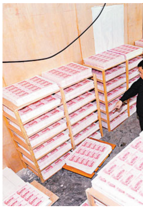
■圖為堆積成山的假鈔半成品。