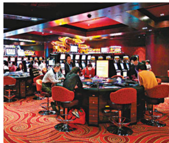
■屬土的博彩業今年會有較佳表現。

香港文匯報訊（記者 周紹基）根據里昂證券的風水指數報告預計，蛇年的上半年恒生指數走勢較佳，5至7月會由資源股帶領大市向上，恒指全年高位將在7月底出現，但下半年大市會較波動，恒指稍為回落，至年底才會稍為好轉。行業方面，里昂主要看好屬土的券商及金融類股份，以及屬土的濠賭股及物流行業。至於環球金融形勢，則預計澳洲表現最佳，美國前景較為暗淡。