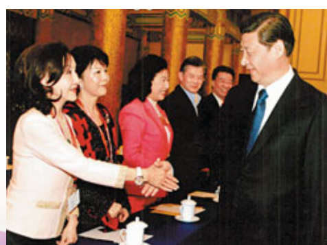
■2010年，時任國家副主席習近平接見全國政協委員鄭明明。