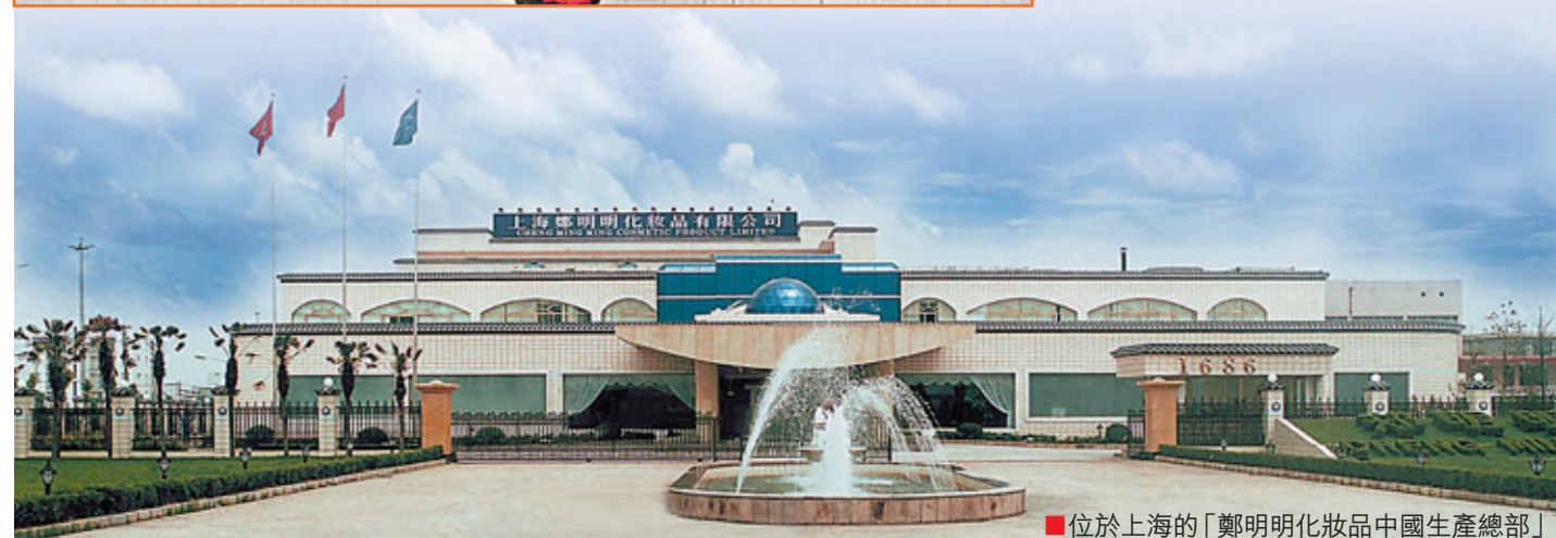
■位於上海的「鄭明明化妝品中國生產總部」