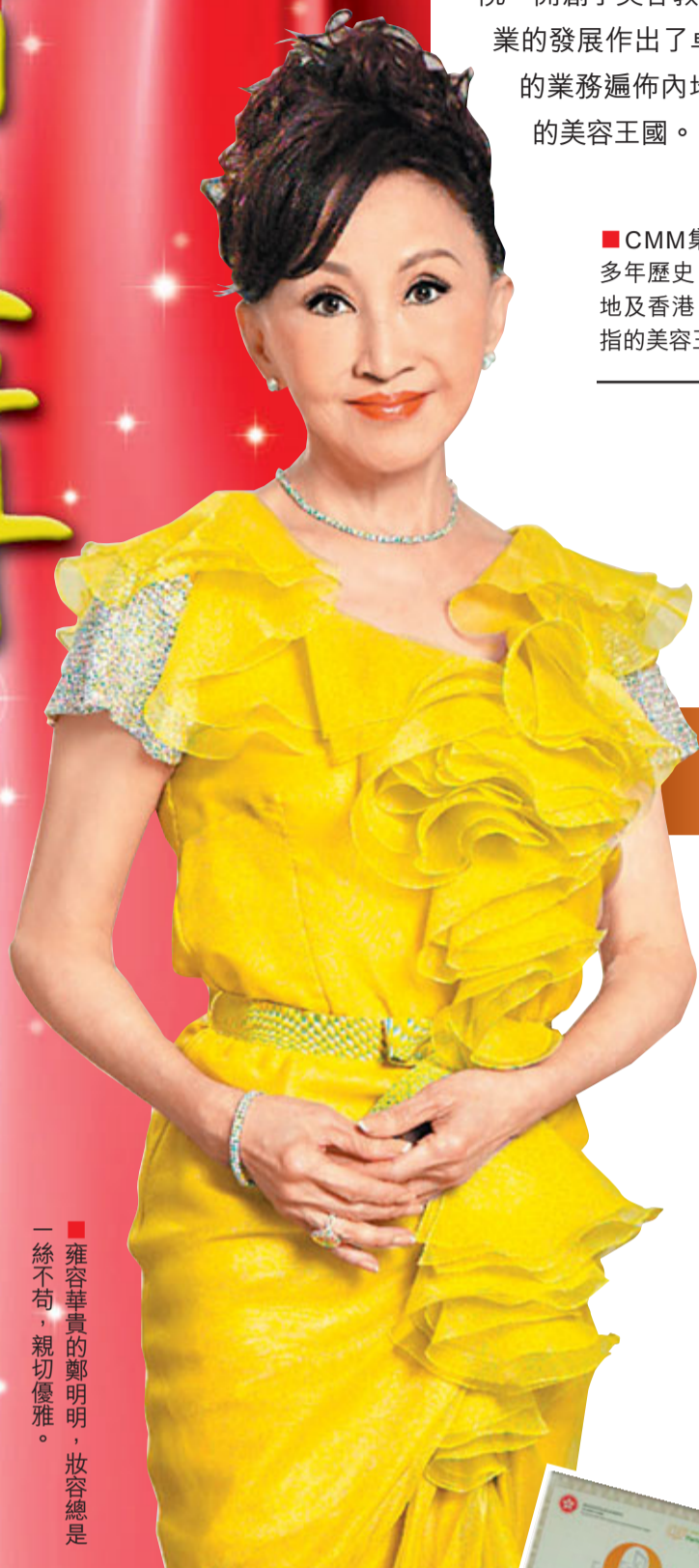
雍容華貴的鄭明明，妝容總是一絲不苟，親切優雅。

全國政協委員、CMM國際集團董事長鄭明明，被譽為「國際美容教母」，其美容王國由教育開始，在內地剛改革開放即在北京開辦學校，把美容教育及自家品牌帶進中國，憑着父親言傳身教的不倒翁奮鬥精神，成功鑄成「鄭明明」國際美容界知名品牌響遍大江南北，成為全國美容行業認可的專業與優質標誌，所創辦的「蒙妮坦」美容學院，開創了美容教育的先河，為中國美容事業的發展作出了卓越的貢獻；現時，集團的業務遍佈內地及香港，成為首屈一指的美容王國。