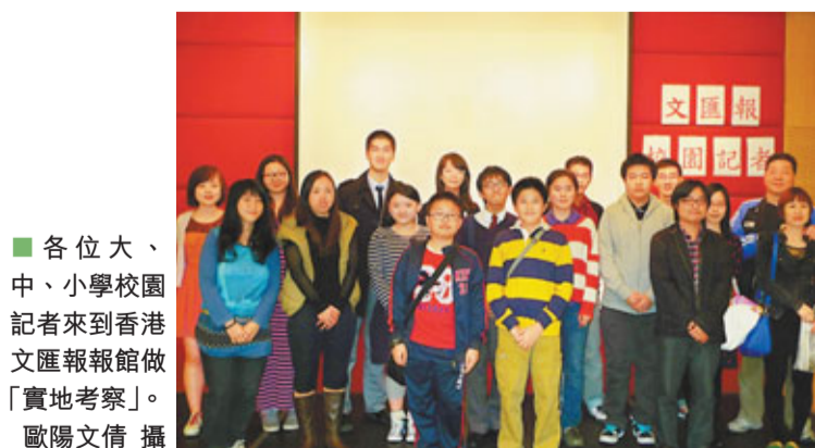
各位大、中、小學校園記者來到香港文匯報報館做「實地考察」。

香港文匯報訊（記者 歐陽文倩）為了讓學生通過新聞採訪感知社會冷暖，培養對社會的責任感，並讓他們了解媒體運作，提升觀察、分析及語文能力，《香港文匯報》舉辦了「文匯報校園記者」計劃，帶領一眾大、中、小學生走進報館，學習新聞採訪技巧，透過多元活動提升學生的新聞觸覺，並讓他們在最後的實習採訪中學以致用。