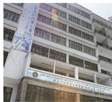
科專同時有辦毅進課程，校方相信生源並不缺。資料圖片