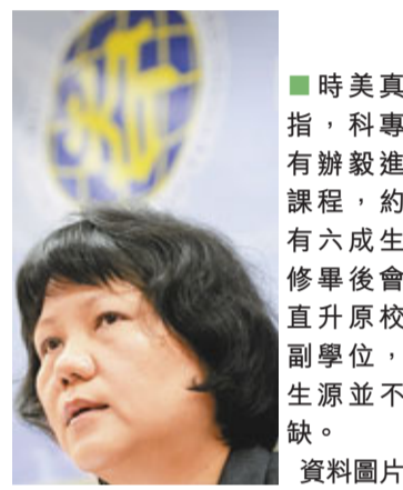
時美真指，辦毅進課程，約有六成生修畢後會直升原校副學位，生源並不缺。資料圖片