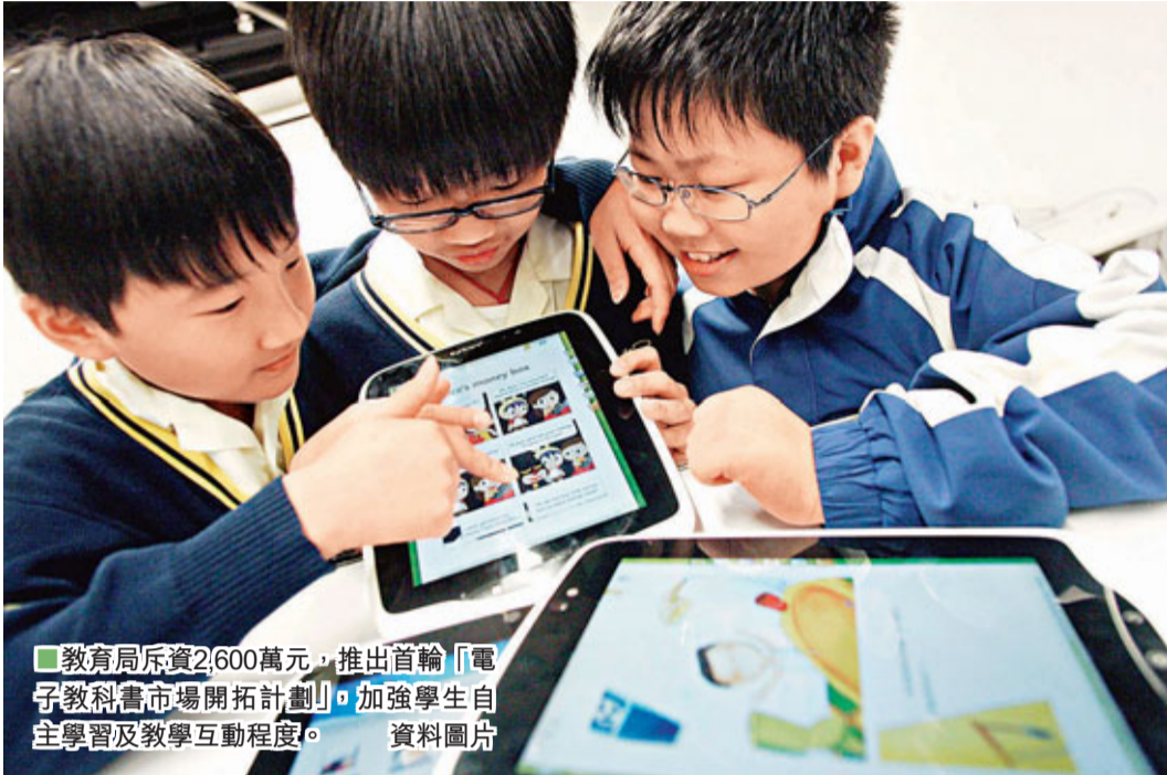
■教育局斥資2,600萬元，推出首輪「電子教科書市場開拓計劃」，加強學生自主學習及教學互動程度。 資料圖片