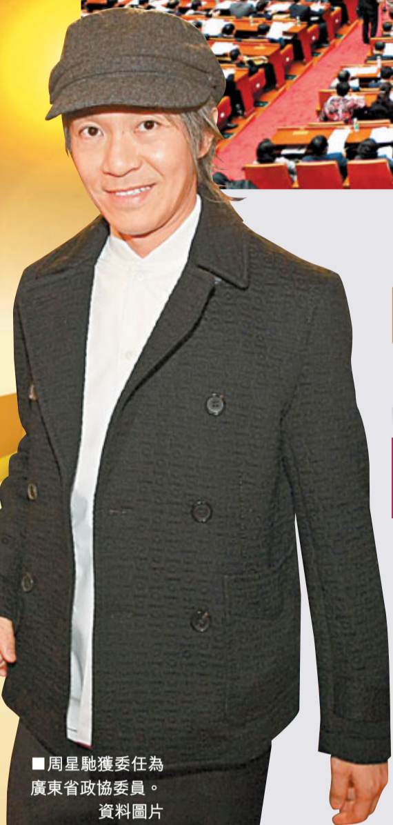
周星馳獲委任為廣東省政協委員。