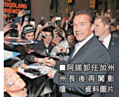
阿諾卸任加州州長後再闖影壇。 資料圖片

後，獲得電影演出機會。《未來戰士》(The Terminator)的演出奠定他在電影界的地位。2003年，他參加加州州長選舉，並成功勝出。當中最為人記得的是，他在競選期間被人擲了一隻雞蛋，打中肩膀，不但沒有生氣，反而幽默地說：「這傢伙還欠我一片煙肉。」連任州長後，阿諾舒華辛力加告別政壇，重回電影界。他在任期後段，飽受婚外情醜聞困擾。