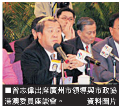
曾志偉出席廣州市領導與市政協港澳委員座談會。 資料圖片