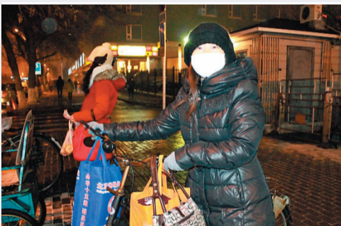
■國小姐戴着口罩,從地鐵口出來,準備推車回家。

由於地面溫度在零度以下,雪落在地面,立即凝結,光滑堅硬如鐵甲的現象俗稱「地穿甲」。北京上一次出現「地穿甲」已是2001年、2002年的事。一位的士司機稱,「霧霾天」遇上「地穿甲」,能見度差與地濕路滑的結合可謂雪上加霜。