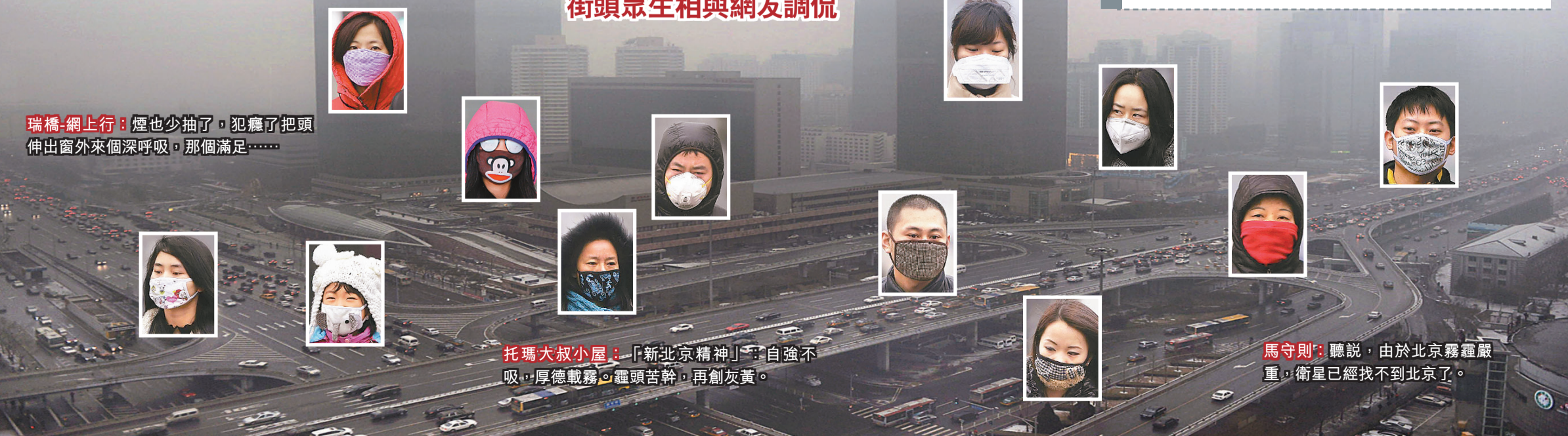
瑞橋:網上行:煙也少抽了,犯癮了把頭伸出窗外來個深呼吸,那個滿足.....