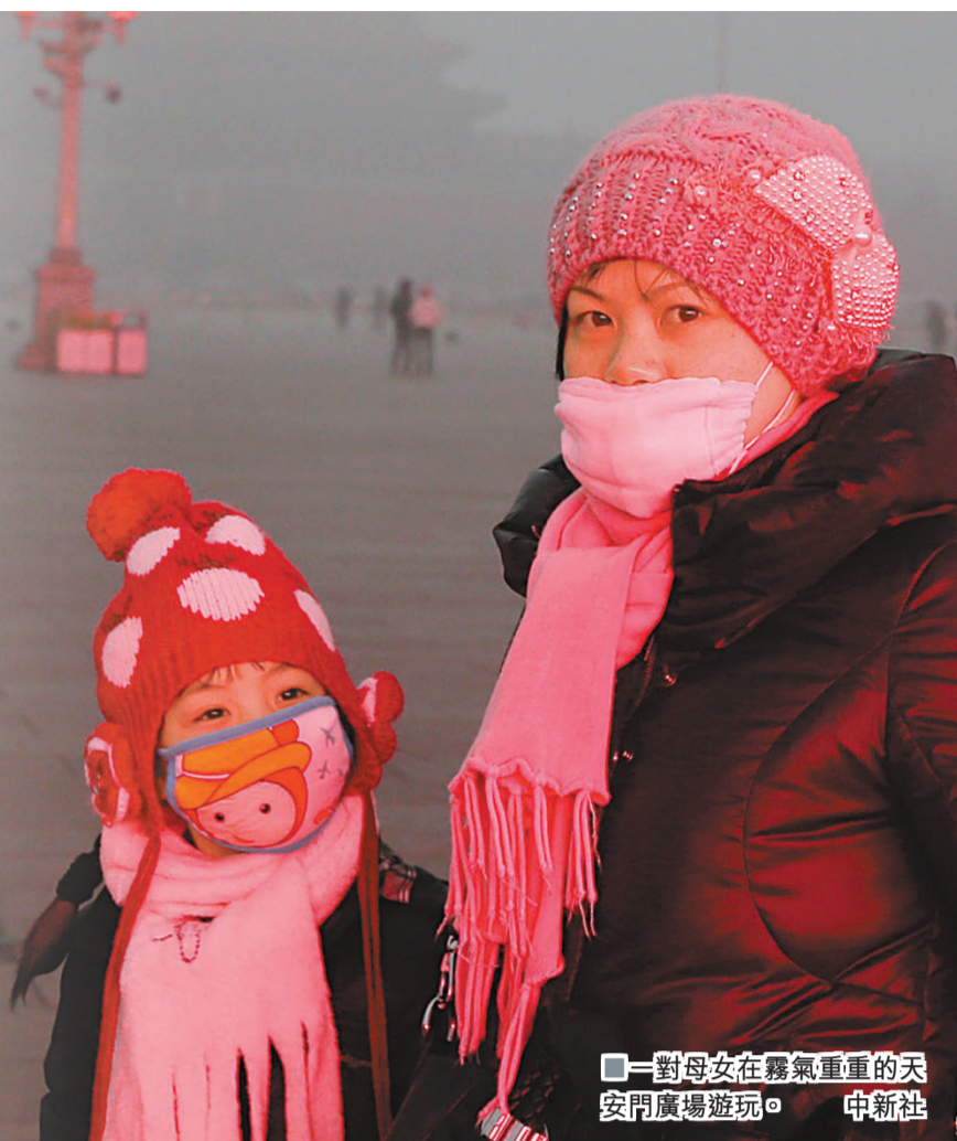
一對母女在霧氣重重的天安門廣場遊玩。