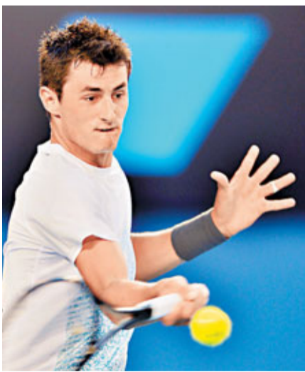
■湯米奇屢次違反交通條例。 資料圖片

多次違反交通條例的湯米奇死性不改，據報該名20歲澳洲男網新星周二在黃金海岸駕駛其黃色法拉利跑車超速，因而被警察截停和扣3分，由於有多次前科的湯米奇只餘1分可扣，結果慘遭吊銷駕駛執照。