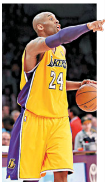
■拜仁減少出手次數對湖人是件好事。

盼了半季後，湖人終於找到勝利鑰匙——拜仁的轉變。認真防守、拚搶籃板、積極傳球，拜仁連續打出「三雙」成績的比賽，幫助湖人連下三城，對手包括聯盟最為火熱的雷霆。有人戲稱拜仁已是「魔術手」附體。的確，他連續3場比賽距離「三雙」僅一步之遙，總共送出令人驚訝的39次助攻。正是他的無私，成為病魔纏身的湖人的一劑良藥。