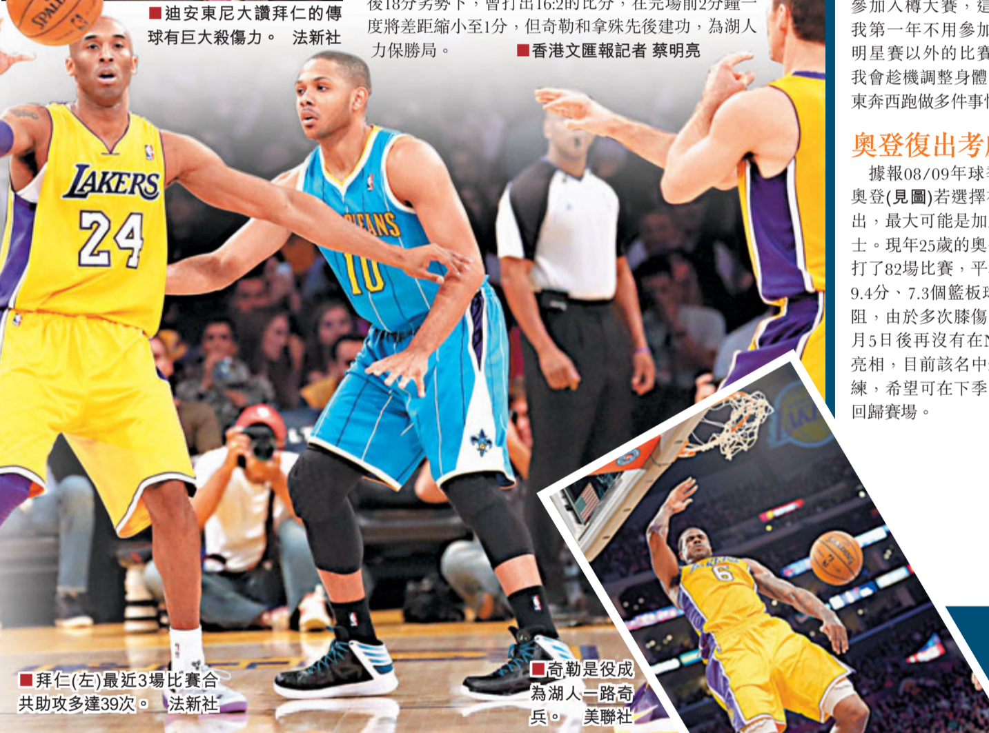
■拜仁(左)最近3場比賽合共助攻多達39次。