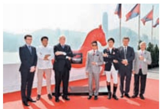
一眾嘉賓在馬像雕塑前合照，象徵「浪琴表香港馬術大師賽」正式降臨香港。

的場地佔地面積達270,000平方呎，將會化身為三大區域：80,000平方呎的馬廄將會容納80隻全球最優秀的馬匹，100,000方呎的馬匹練習場及90,000平方呎的主賽場。觀眾將可近距離欣賞刺激的馬術運動，亦可於場內參與各項活動如「騎師會面」、會議與論壇、以及品酒會，以了解更多有關馬匹、馬術障礙賽、及其他生活悠閒體驗。