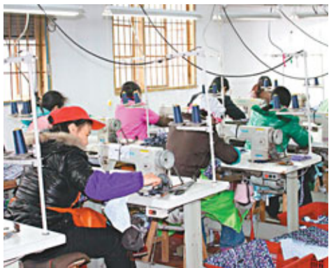
江西萍鄉市一製衣廠裡，民工在埋頭苦幹。

香港文匯報訊（記者 陳融雲 江西報導）臨近春節，農民工討薪成為常規性難題熱點。為獲得關注，不惜集體下跪、跳騎馬舞，「元芳」、「狄仁傑」齊齊扮上。中國人力資源和社會保障部25日召開新聞發佈會，要求各地為農民工討薪建立「綠色通道」，快速解決。在此背景下，江西萍鄉主動成立聯合執法檢查組，幫農民工討薪過年，被稱為溫情指數最高的城市。記者在採訪中了解到，該市已實現重大敏感時期「零上訪」，而該市市長陳衛民表示，政府就是為人民服務。