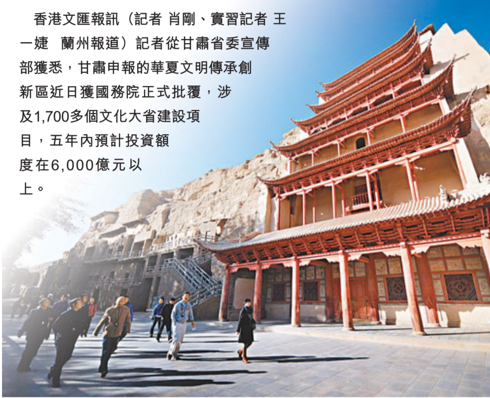
華夏文明傳承創新區將建設敦煌文化為核心的河西走廊文化生態區。圖為敦煌名勝莫高窟。

香港文匯報訊（記者 肖剛、實習記者 王一婕 蘭州報導）記者從甘肅省委宣傳部獲悉，甘肅申報的華夏文明傳承創新區近日獲國務院正式批覆，涉及1,700多個文化大省建設項目，五年內預計投資額在6,000億元以上。